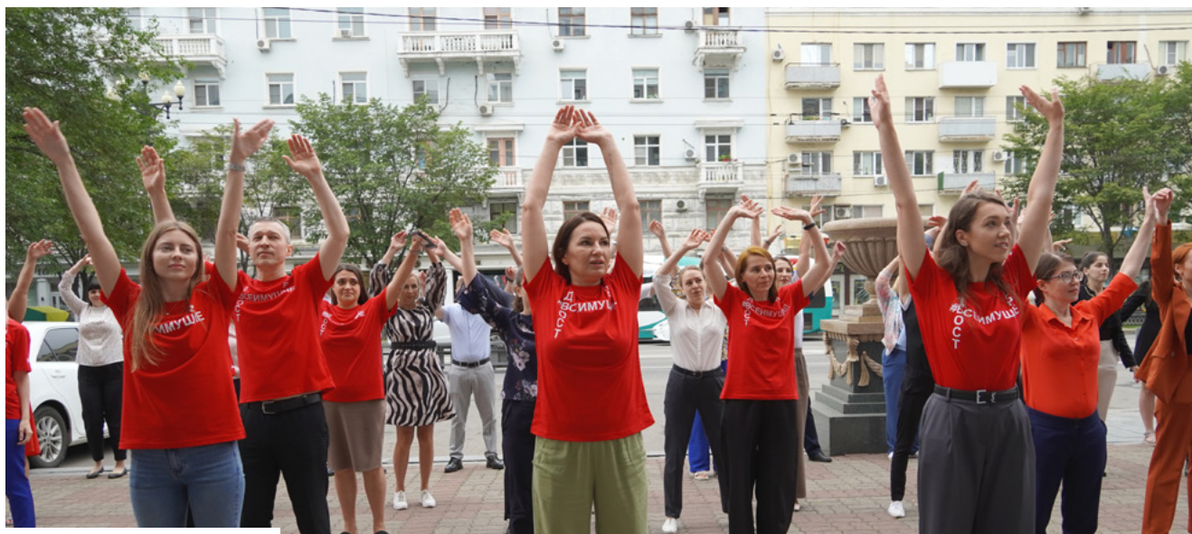
Продолжение. Начало на стр. 1