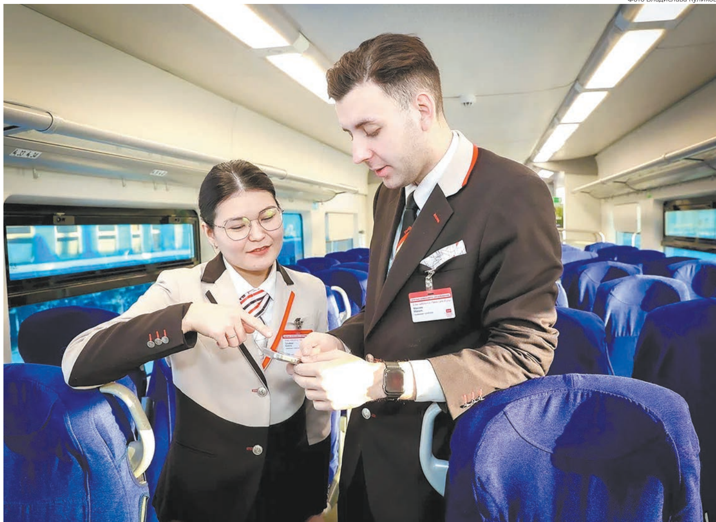
Пользоваться личным кабинетом можно на компьютере, планшете, смартфоне