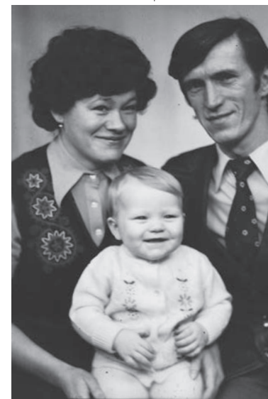
Семья Зоболевых на БАМе