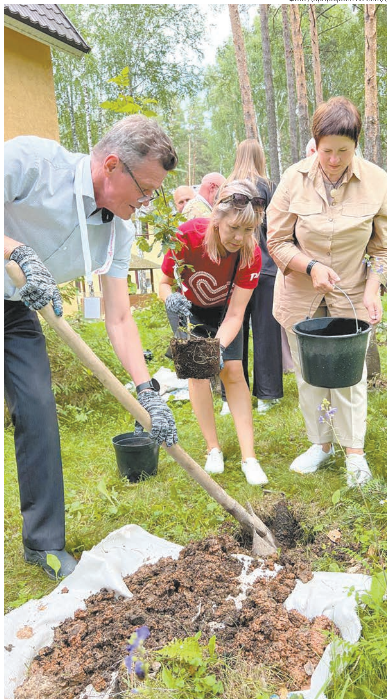
Участники мероприятия высадили «аллею Памяти»