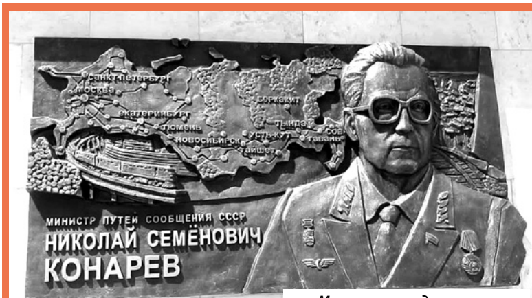
Мемориальная доска в память о Н.С. Конареве на здании Тындинского железнодорожного вокзала