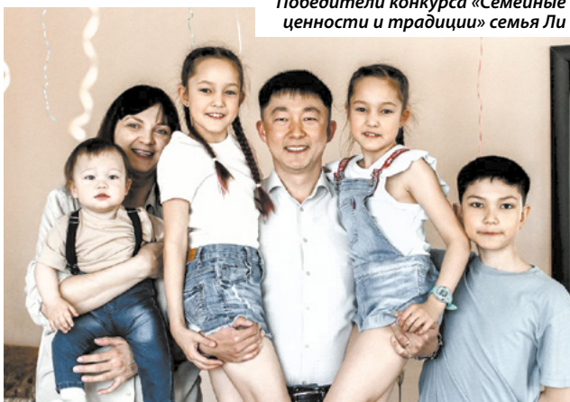
Победители конкурса «Семейные ценности и традиции» семья Ли