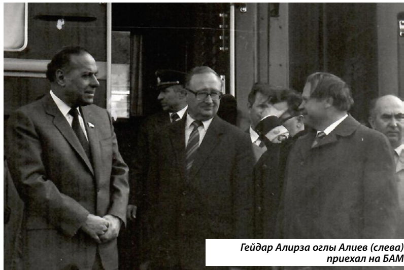
Гейдар Алирза оглы Алиев (слева) приехал на БАМ