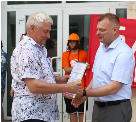
(Окончание. Начало на стр. 1)

Гранитный постамент декорирован бронзовой композицией, воплощающей историю жизни бамовцев и путь легендарной железной магистрали. С обеих сторон скульптуры расположены сюжетные группы, изображающие строителей, отправляющихся на Стройку века, моменты укладки рельсов, а также повседневные занятия и быт.