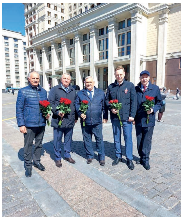
Работники транспортного комплекса почтили память воинов и возложили цветы к Вечному огню у Могилы Неизвестного Солдата в Москве