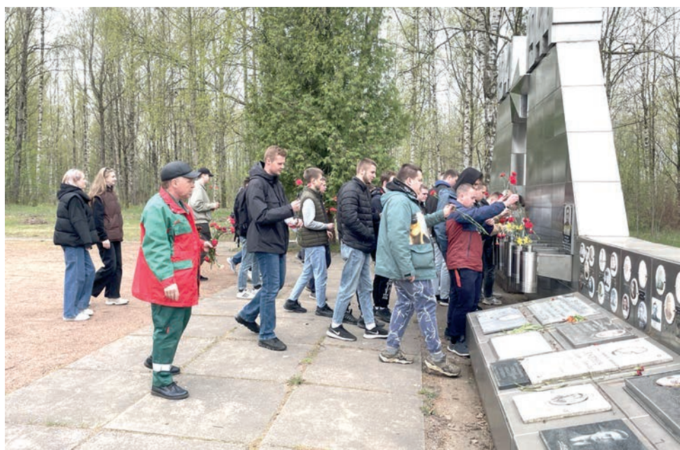
Первички Северо-Западной дирекции скоростного сообщения и Санкт-Петербургского техникума железнодорожного транспорта организовали акцию по возложению цветов к мемориалу «Синявинские высоты»