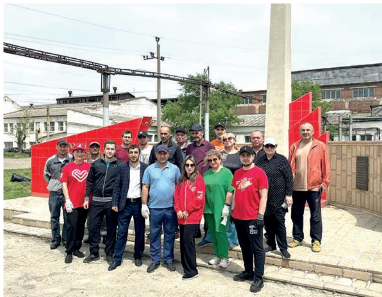
В преддверии празднования 79-й годовщины Победы в Великой Отечественной войне работники вагонного депо Махачкала организовали субботник у памятника «Героям, отдавшим жизнь за Родину»