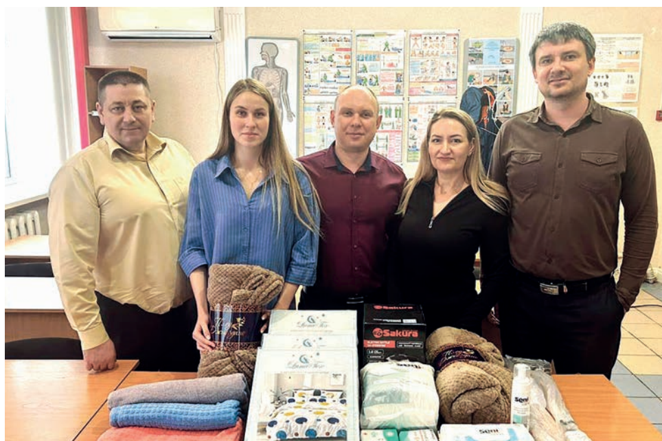
Работники Хабаровской дистанции инженерных сооружений участвовали в акции «Вагончик добра» и собрали подарки для ветеранов