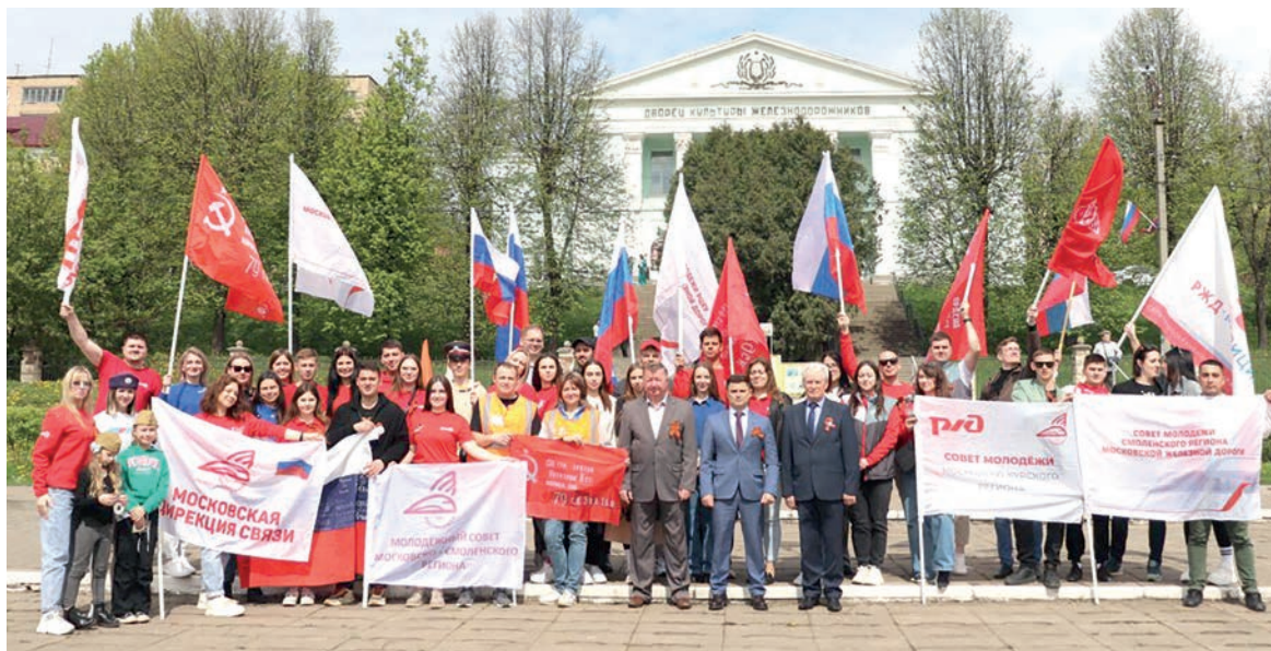
Совет молодежи МЖД организовал автопробег по местам боевой славы Смоленска и Смоленской области, посвященный 79-й годовщине Победы