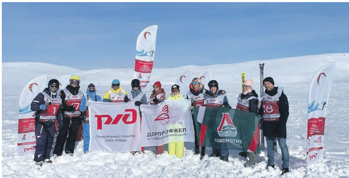
При поддержке Дорпрофжел на ОЖД и РКСО «Локомотив» в Мурманской области стартовали соревнования на кубок Октябрьской железной дороги по парусному спорту в классе «сноукатинг»