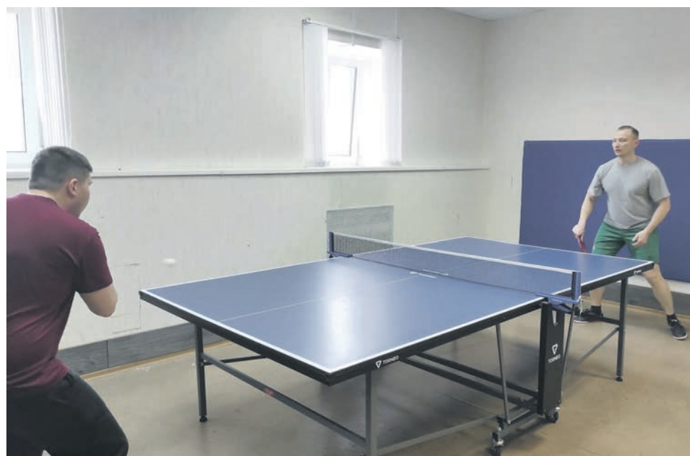
Первичная профсоюзная организация Сольвычегодского регионального центра связи Северной магистрали провела теннисный турнир для сотрудников