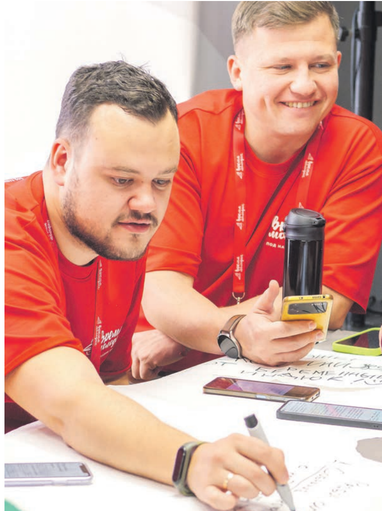
Участников программы «Время молодых. Работники» в этом году поделят на целевые группы