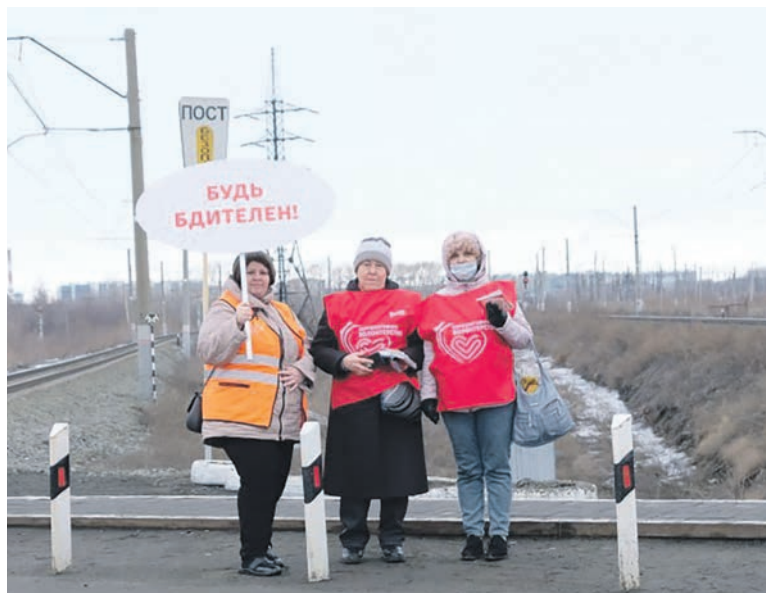
Железнодорожники Южно-Уральской магистрали на 2109 км напомнили водителям основные правила пересечения переездов