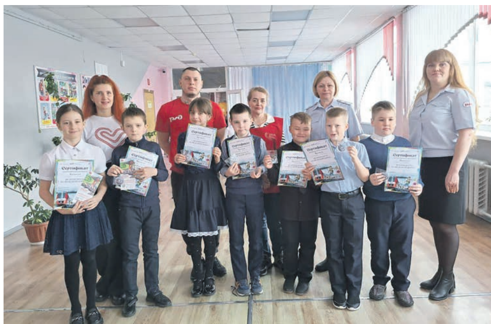
Тындинский региональный штаб волонтеров провел для третьеклассников общеобразовательной школы № 7 урок на тему «Безопасная железная дорога»