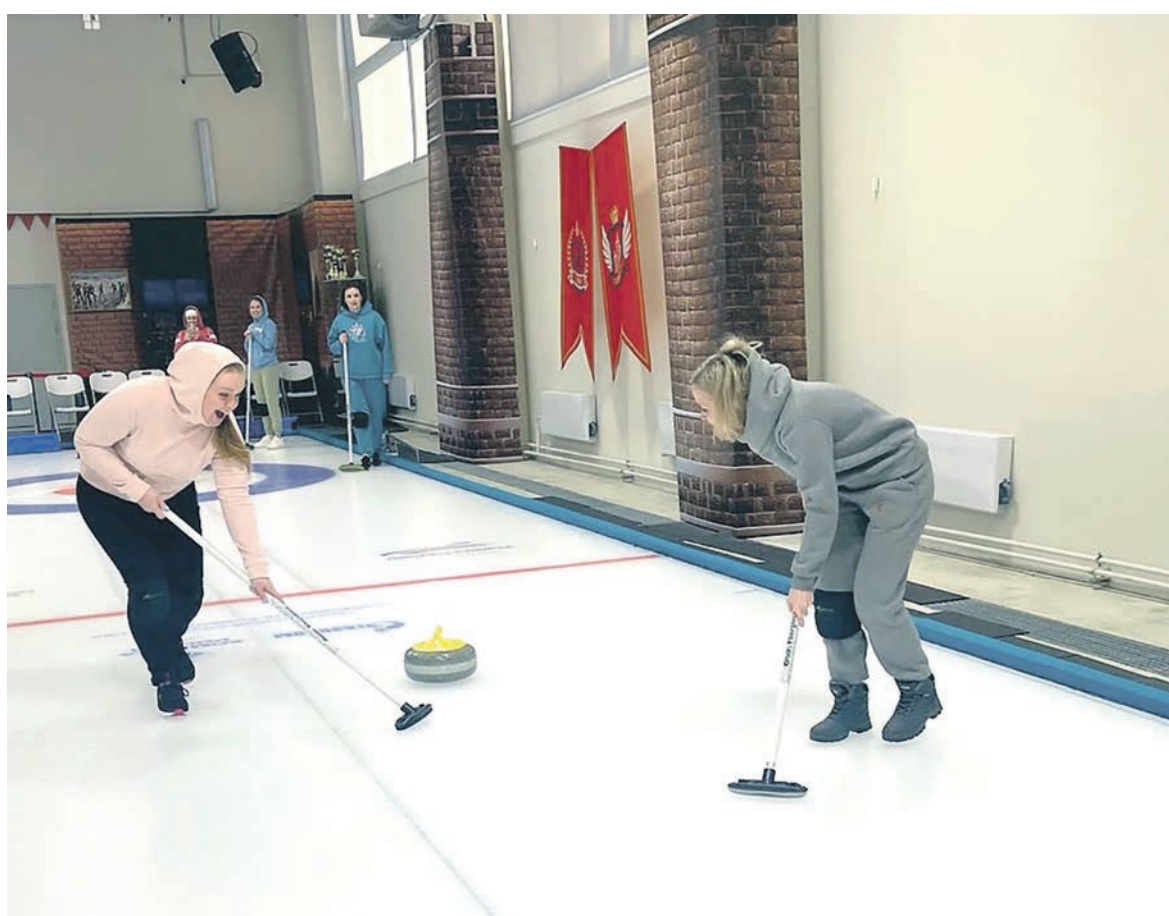
Профком Куйбышевской дирекции по ремонту тягового подвижного состава вывез желающих в самарский Ледовый дворец, чтобы размяться в «шахматах на льду»