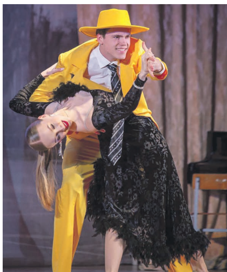
В Ростовском государственном университете путей сообщения прошел первый этап прослушиваний на гала-концерт, посвященный «Студенческой весне»