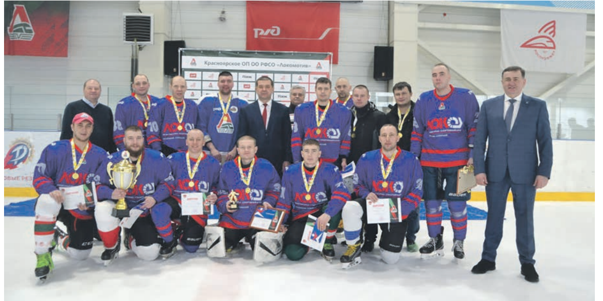
В ледовом дворце «Рассвет» прошел чемпионат работников Красноярской железной дороги по хоккею с шайбой. Титул чемпиона завоевала команда работников станции Саянская