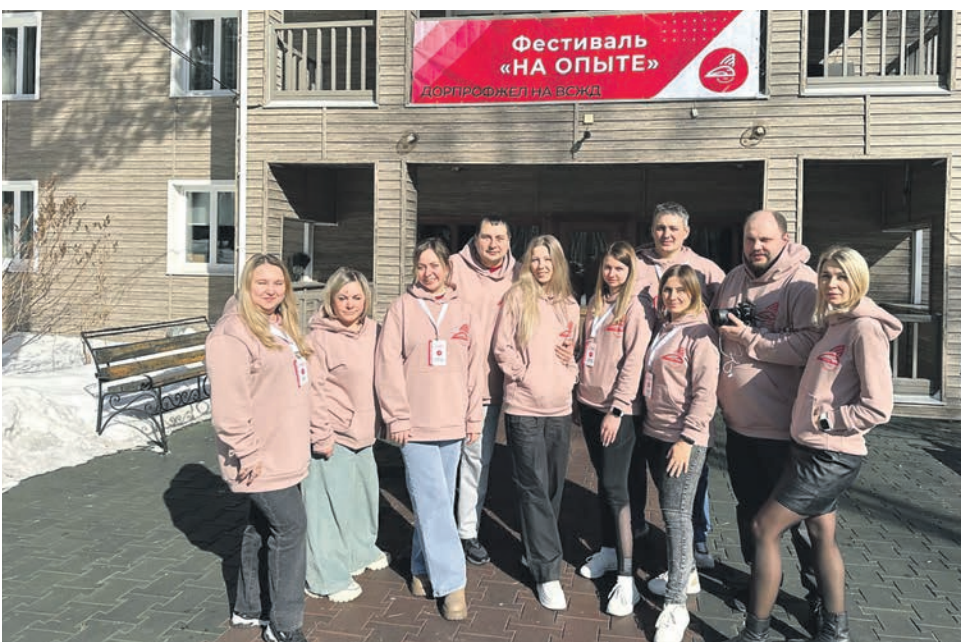
Впервые Дорпрофжел на ВСЖД провел фестиваль «На опыте». Он предназначен для тех, кому за 35