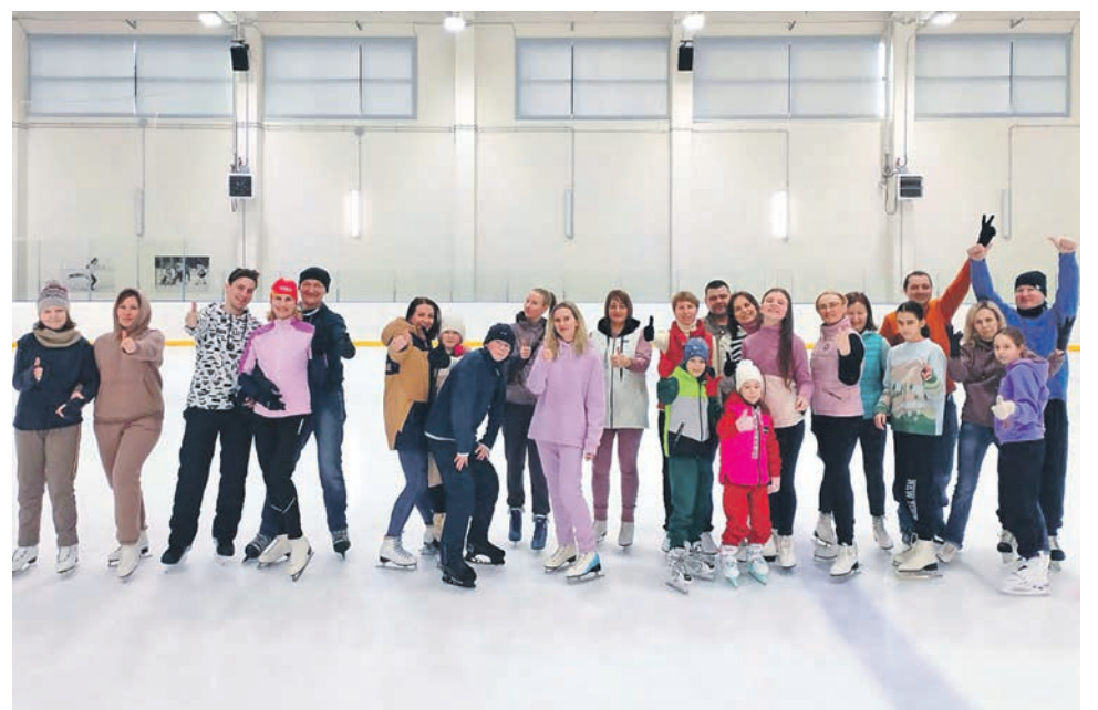
Катание на коньках организовал для членов профсоюза профком Куйбышевского территориального центра фирменного транспортного обслуживания