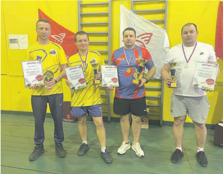
Работники Люблинского железнодорожного узла МЖД сразились в турнире по настольному теннису