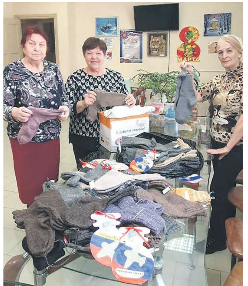
Почти 50 пар теплых носков связали представители узлового совета ветеранов станции Уссурийск ДВЖД для военнослужащих в зоне специальной военной операции