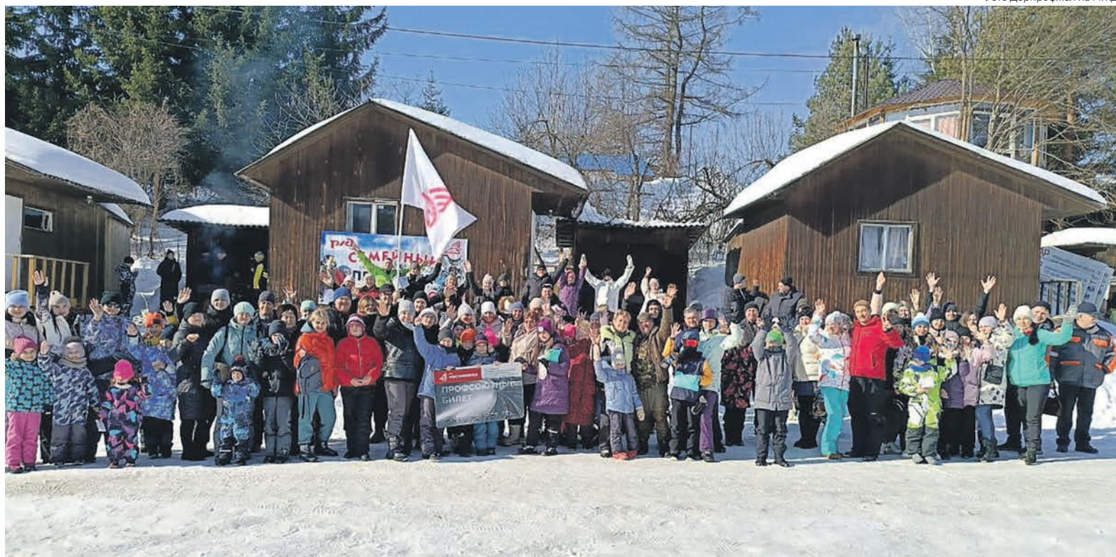
Спортивные семейные мероприятия — обязательная часть поддержки работников и их семей