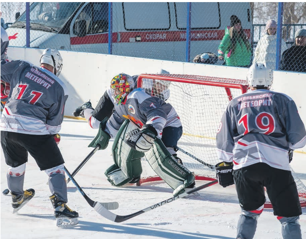
На ЮЖД прошел чемпионат по хоккею с шайбой