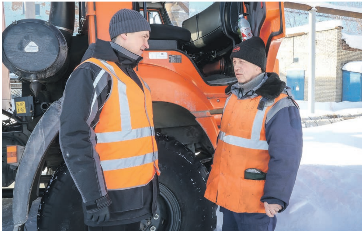
Фото Владислава Куликова