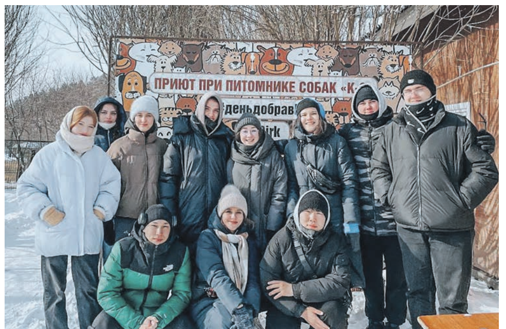
Студенты Иркутского ГУПС посетили питомник К-9, привезли животным медикаменты и корм