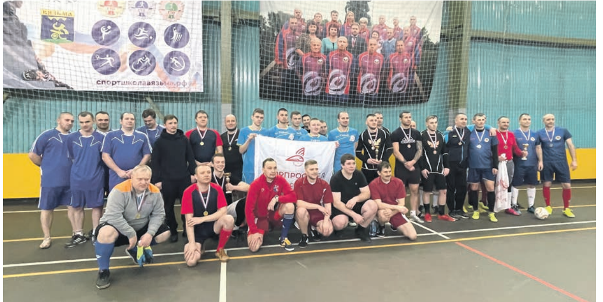
Соревнования по мини-футболу среди команд ППО Вяземского железнодорожного узла и команды Сафоновской дистанции пути прошли в физкультурно-оздоровительном комплексе «Вязьма»