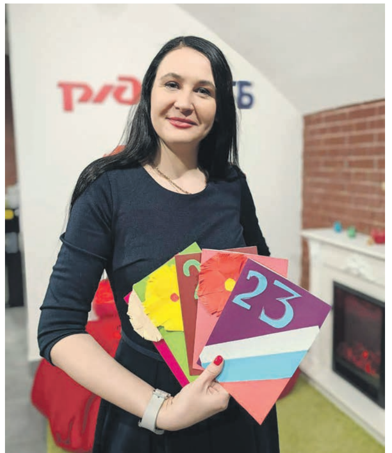
Волонтеры Октябрьской магистрали в «Добростудии» на Московском вокзале Петербурга изготовили открытки ко Дню защитника Отечества для бойцов СВО