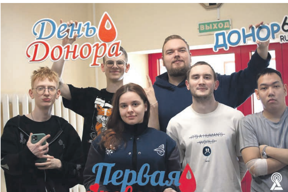
Первичка студентов Самарского ГУПС выступила организатором Дня донора. Кровь сдали 140 студентов и сотрудников