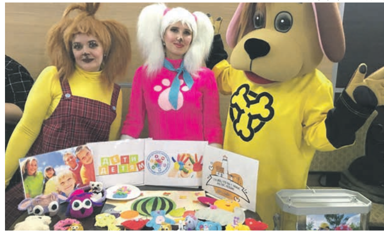
Составил Алексей Пискунов