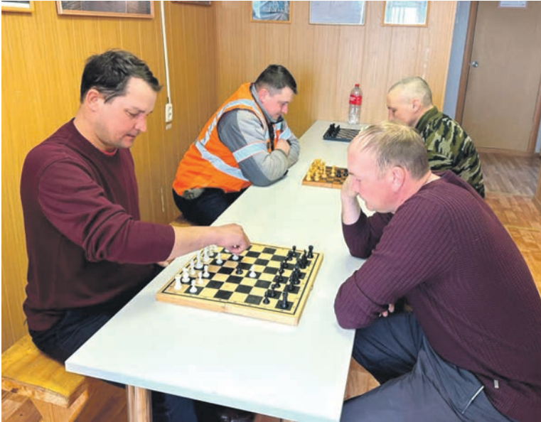
Работники дистанции инженерных сооружений линейного участка станции Кандры сразились в шахматном турнире на приз профсоюзной организации