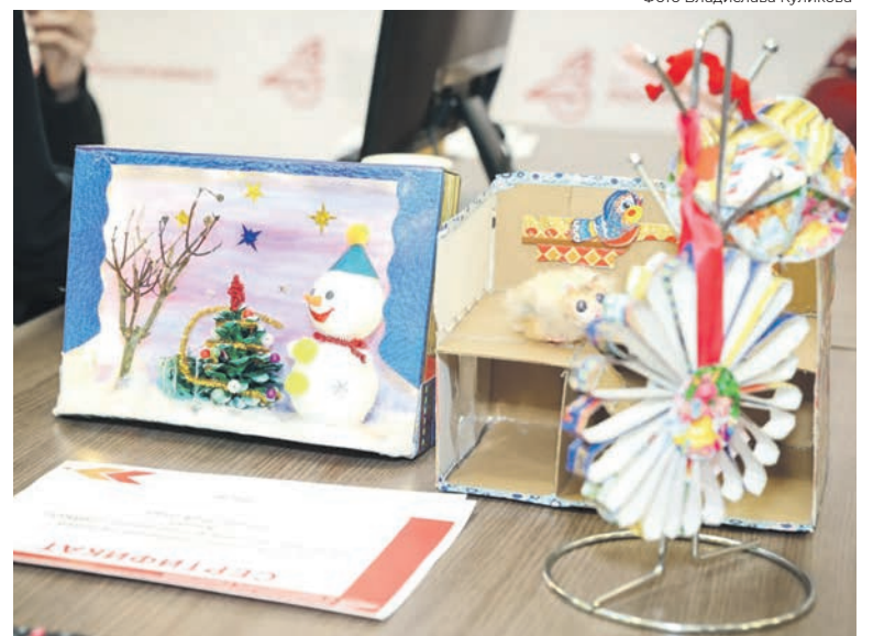
Из упаковки от сладкого подарка можно сделать и украшение на елку, и домик для хомяка