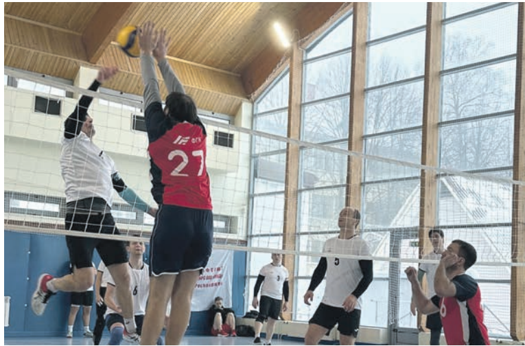
Турнир по волейболу Терпрофжел МОСЖЕЛТРАНС собрал более 150 спортсменов

Спортивный календарь РОСПРОФЖЕЛ в 2024 году будет насыщен яркими и запоминающимися соревнованиями. Первичные организации с первых дней января продолжили традицию поддержки любых инициатив здорового образа жизни среди железнодорожников. Постоянно увеличивается число спортивных дисциплин в коллективах. А ключевое событие года — Железнодорожные игры «Мы вместе» обещает стать настоящим фестивалем массового спорта.