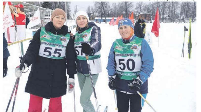
Работники Московско-Курского региона МЖД стали участниками лыжных гонок