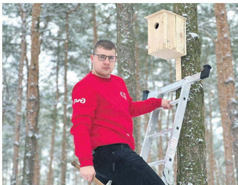
Волонтеры Брянского региона МЖД совместно со школьниками изготовили скворечники и кормушки для птиц