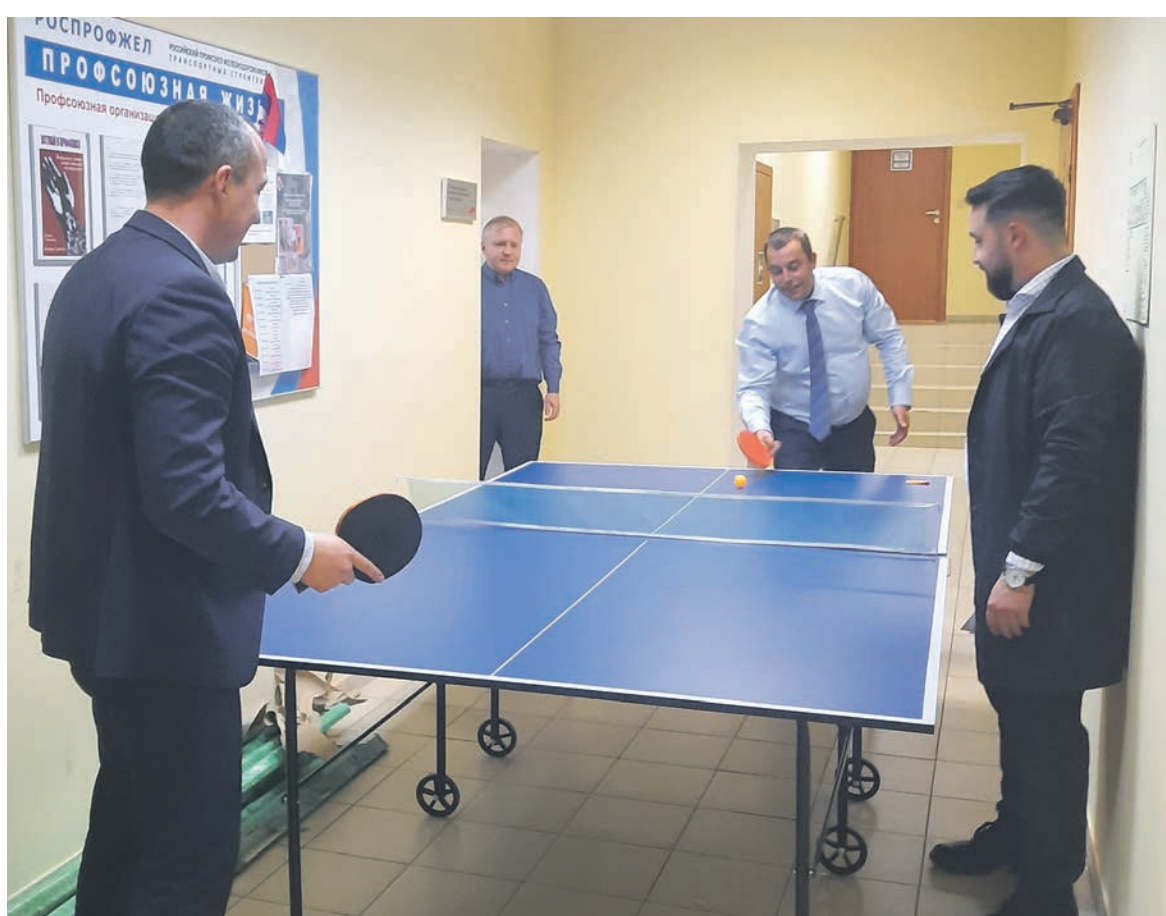
Первичка Московской дирекции по капитальному строительству провела турнир по настольному теннису среди членов профсоюза