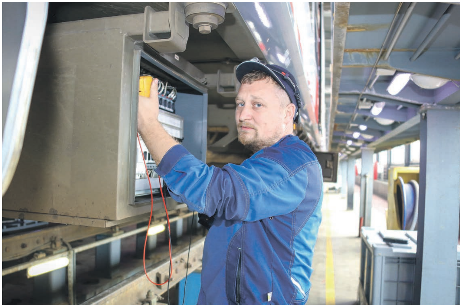
Новая профсоюзная организация создана в компании «ВСМ-Сервис», региональное подразделение которой действует и в депо Крюково