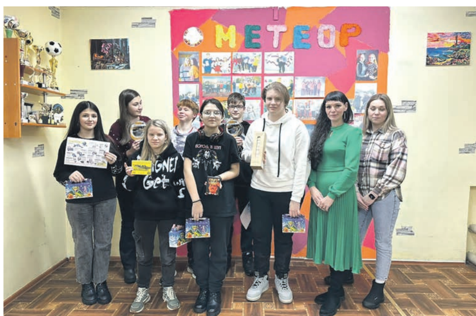
Волонтеры Канда拉克шской дистанции пути им. В.Ю. Лелекова провели акцию «Железная дорога — зона повышенной опасности» для детского центра «Метеор»