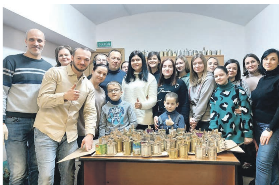
Профактивисты и волонтеры объединились в профсоюзной мастерской Дорпрофжел на ЮВЖД «Все для фронта». Они изготовили более 200 окопных свечей