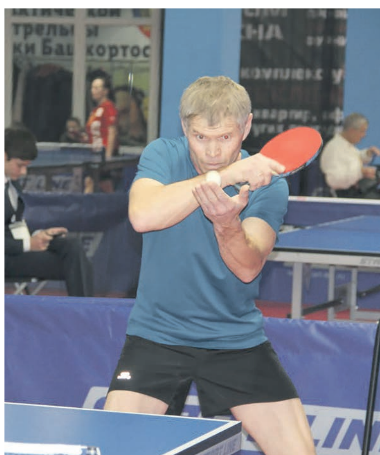
В Уфе разыгран комплект наград первенства по настольному теннису среди работников Башкирского региона Куйбышевской железной дороги