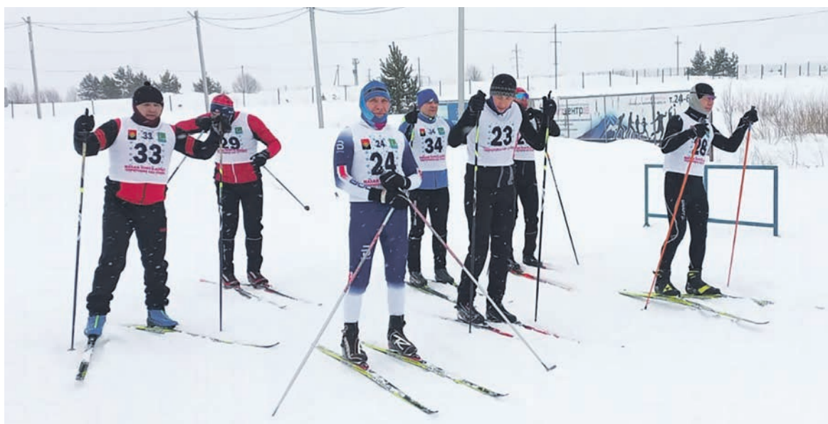
В Ижевском регионе Горьковской магистрали прошли лыжные гонки среди предприятий Ижевского, Агрызского, Сарапульского железнодорожных узлов