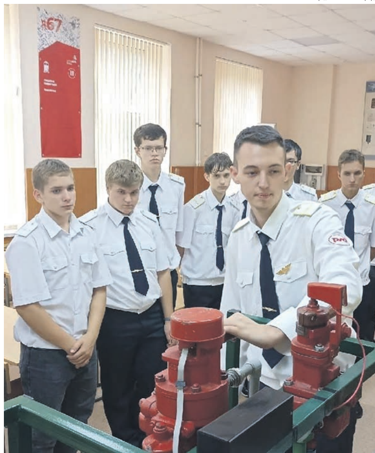
В Минераловодском колледже железнодорожного транспорта созданы две первички — работников и студентов