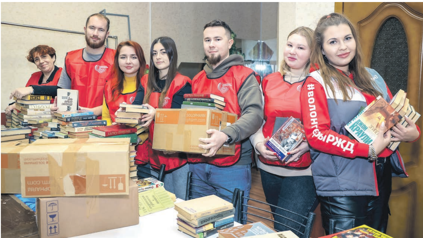
Волонтеры отряда «Добровольцы Сев-Кав» сортируют гуманитарную помощь для отправки в зону СВО и книги для жителей ДНР и ЛНР