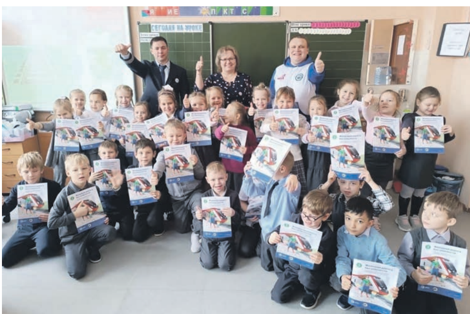
Волонтеры и члены Молодежного совета ППО ЦПК провели урок безопасности для первоклассников Вешняковской школы Москвы