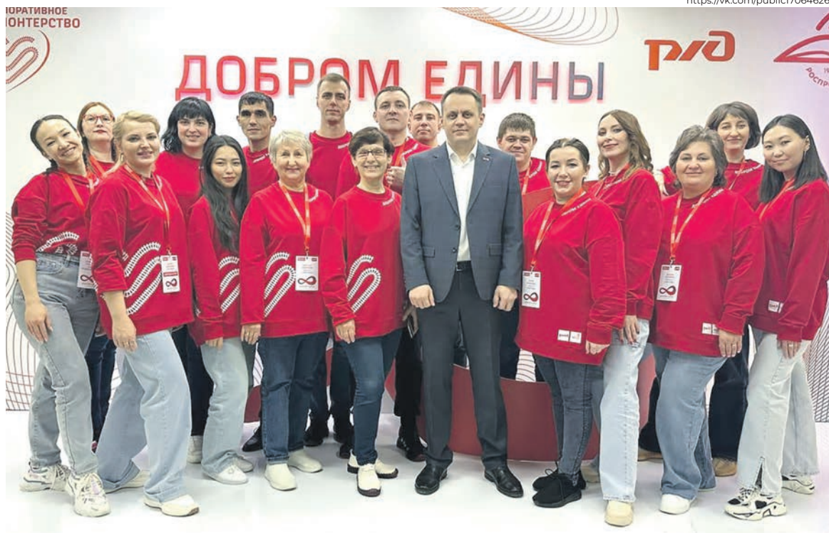
Победители этого года — команда Забайкальской железной дороги

В этом году добровольцы РЖД провели более 3 тыс. мероприятий — в три раза больше, чем планировалось. Ни один