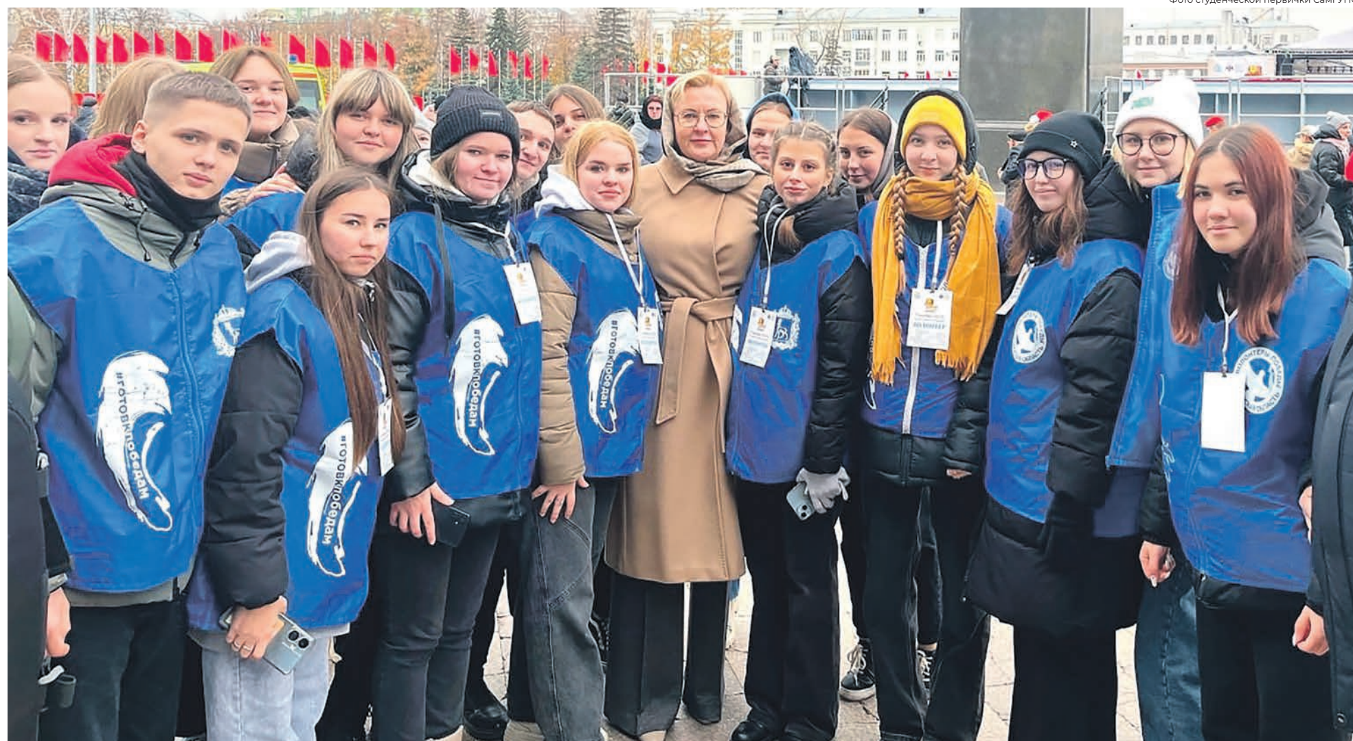
Волонтеры при студенческом профкоме Самарского госуниверситета путей сообщения помогли организаторам Парада Памяти обеспечить порядок на мероприятии