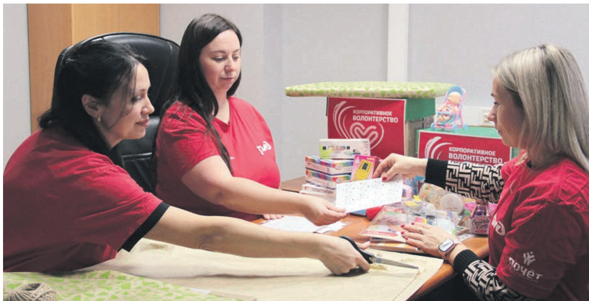
Волонтеры Вологодского региона СЖД стали участниками Всероссийской благотворительной акции «Коробка храбрости», направленной на поддержку детей, проходящих длительное лечение