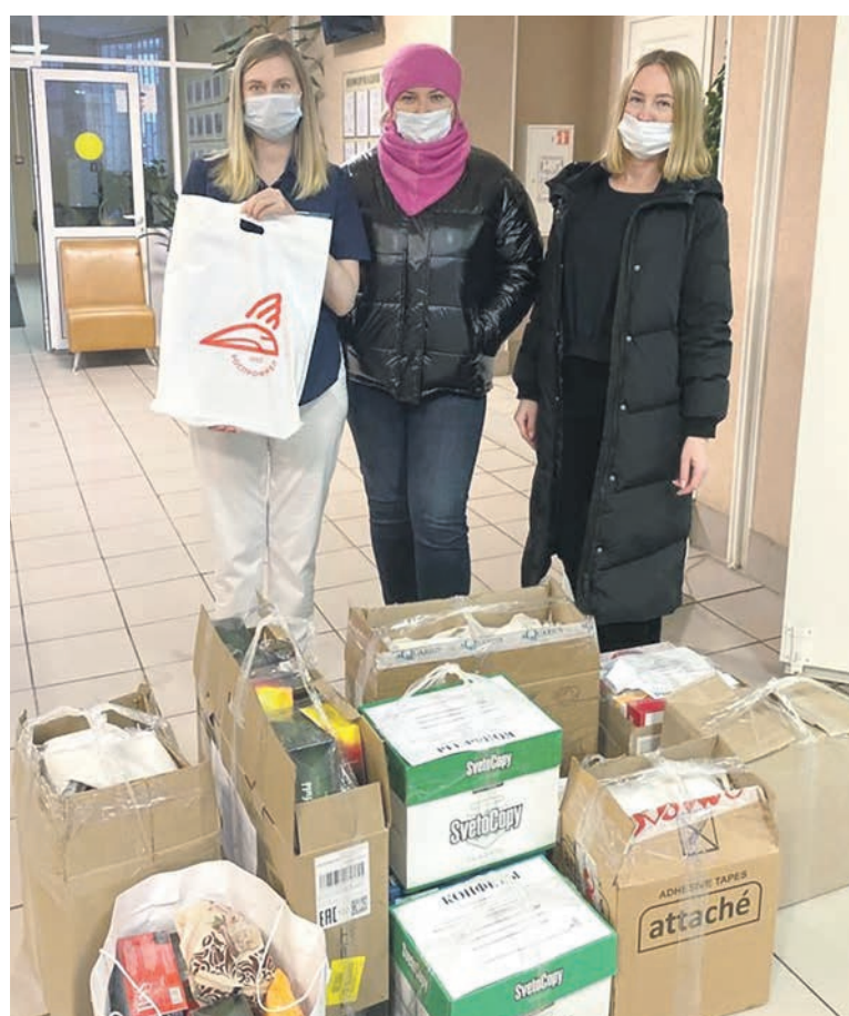
Первичная профсоюзная организация Северо-Западного Центра корпоративного учета и отчетности «Желдоручет» организовала сбор продуктов для пациентов Санкт-Петербургского хосписа № 4