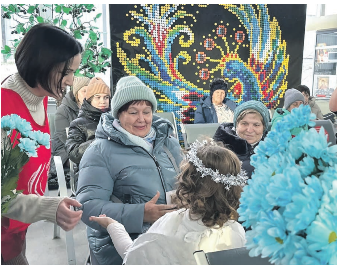
В День Матери волонтеры Курганского отделения ЮУЖД в зале ожидания пригородного вокзала станции Курган поздравили мам, бабушек и беременных женщин