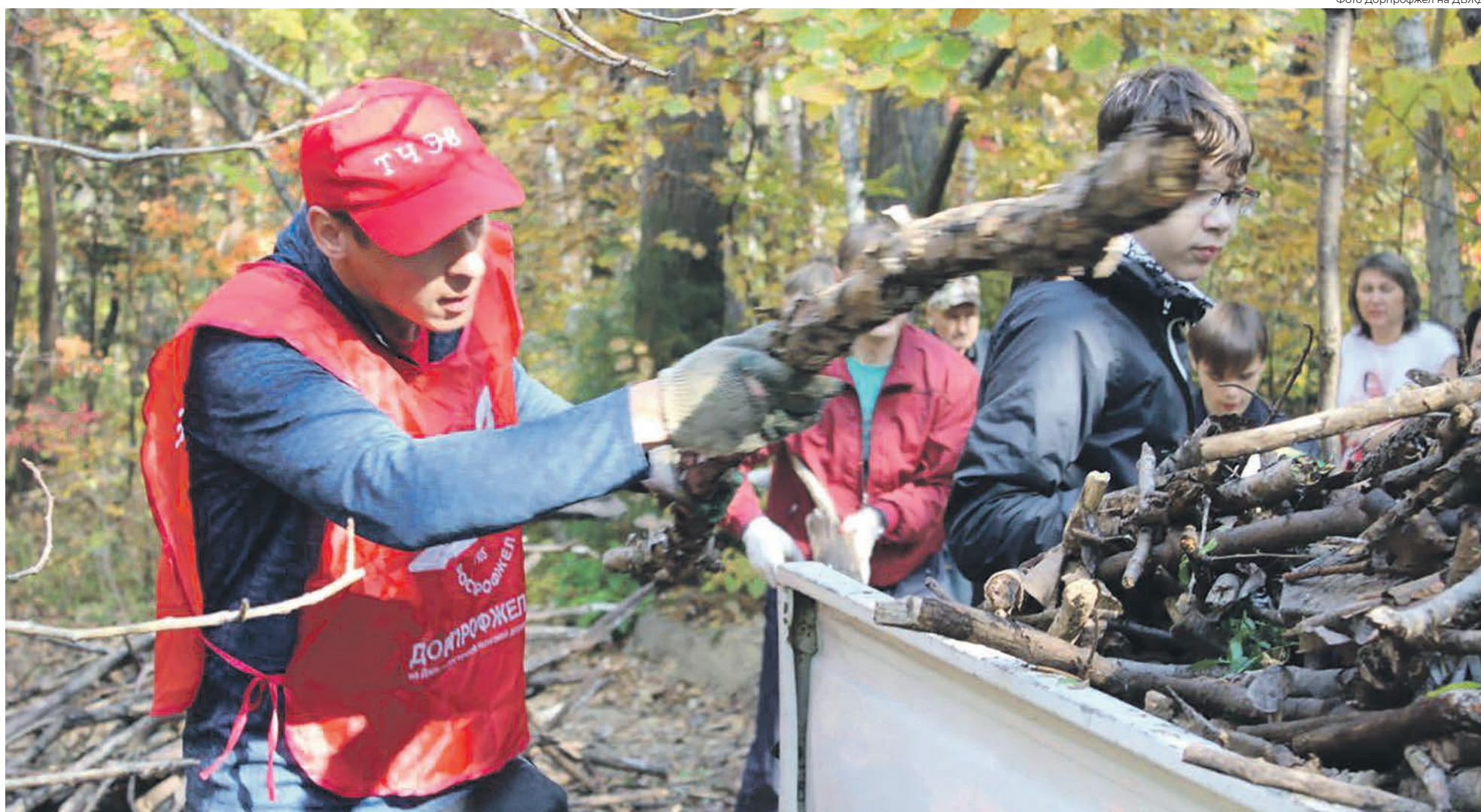
Волонтеры Дорпрофжел на Дальневосточной железной дороге заботятся об экологии