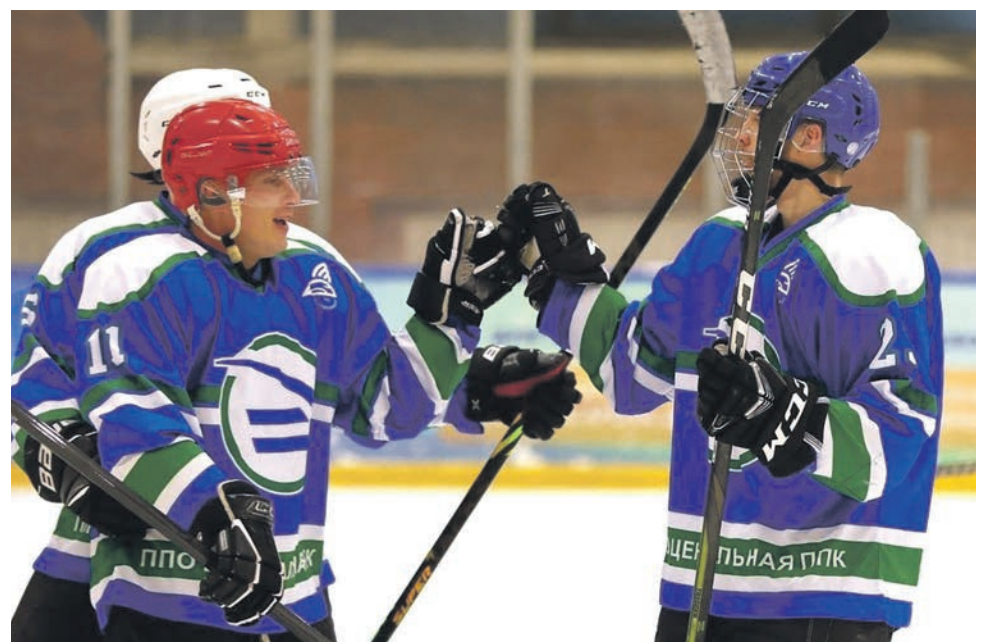
Хоккейная команда ППО АО «Центральная ППК» продолжает дебютировать в играх «Ночная лига»