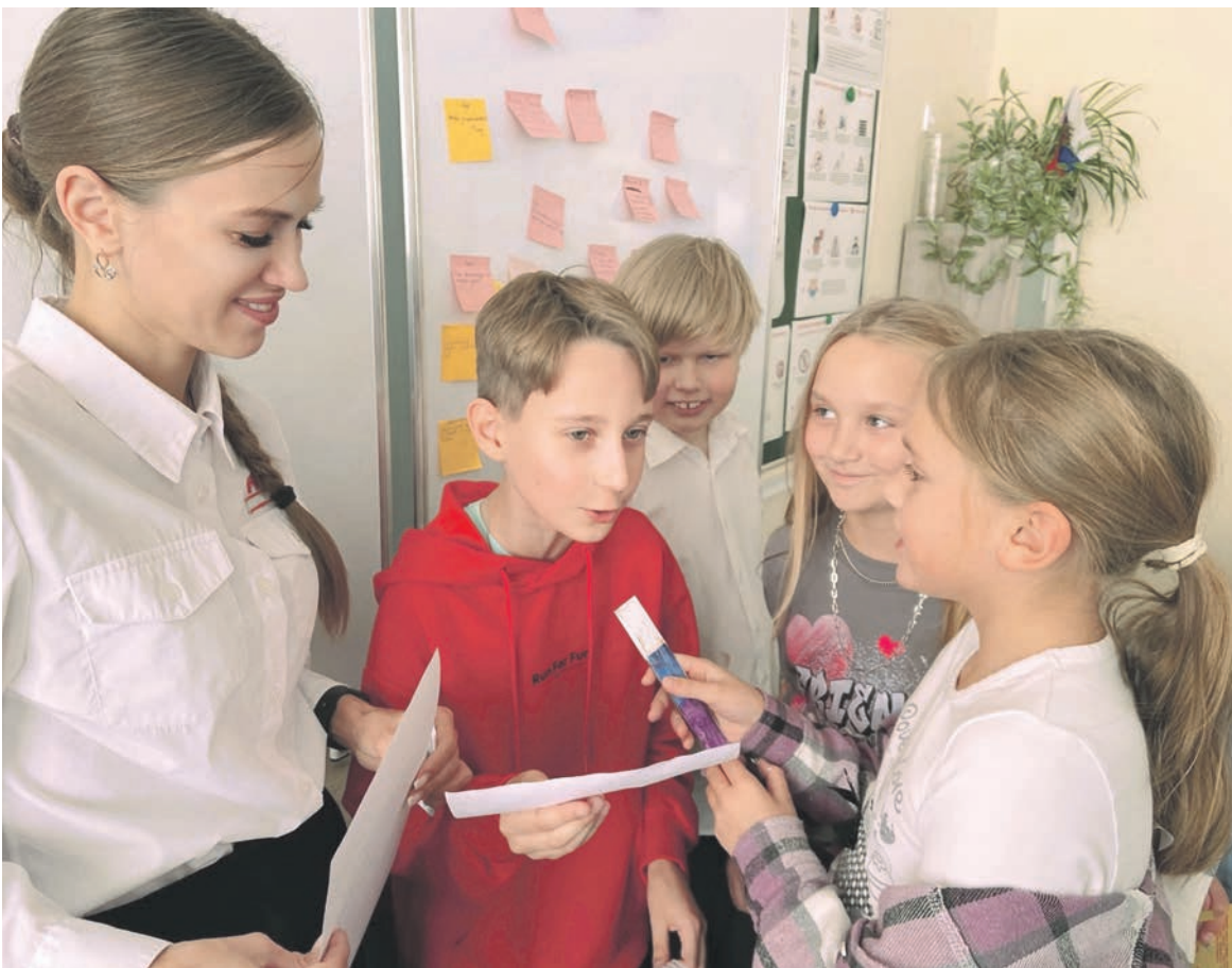
Школьники Центра образования № 1 Белгорода сыграли в познавательно-развивающую игру в сфере профессиональной ориентации, безопасности на железнодорожном транспорте и экологии