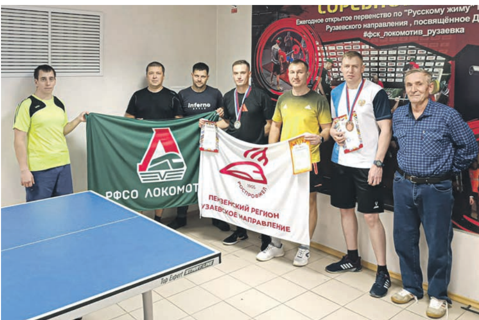
В эксплуатационном локомотивном депо Рузаевка Куйбышевской дирекции тяги прошло первенство по настольному теннису на призы профсоюзной организации предприятия