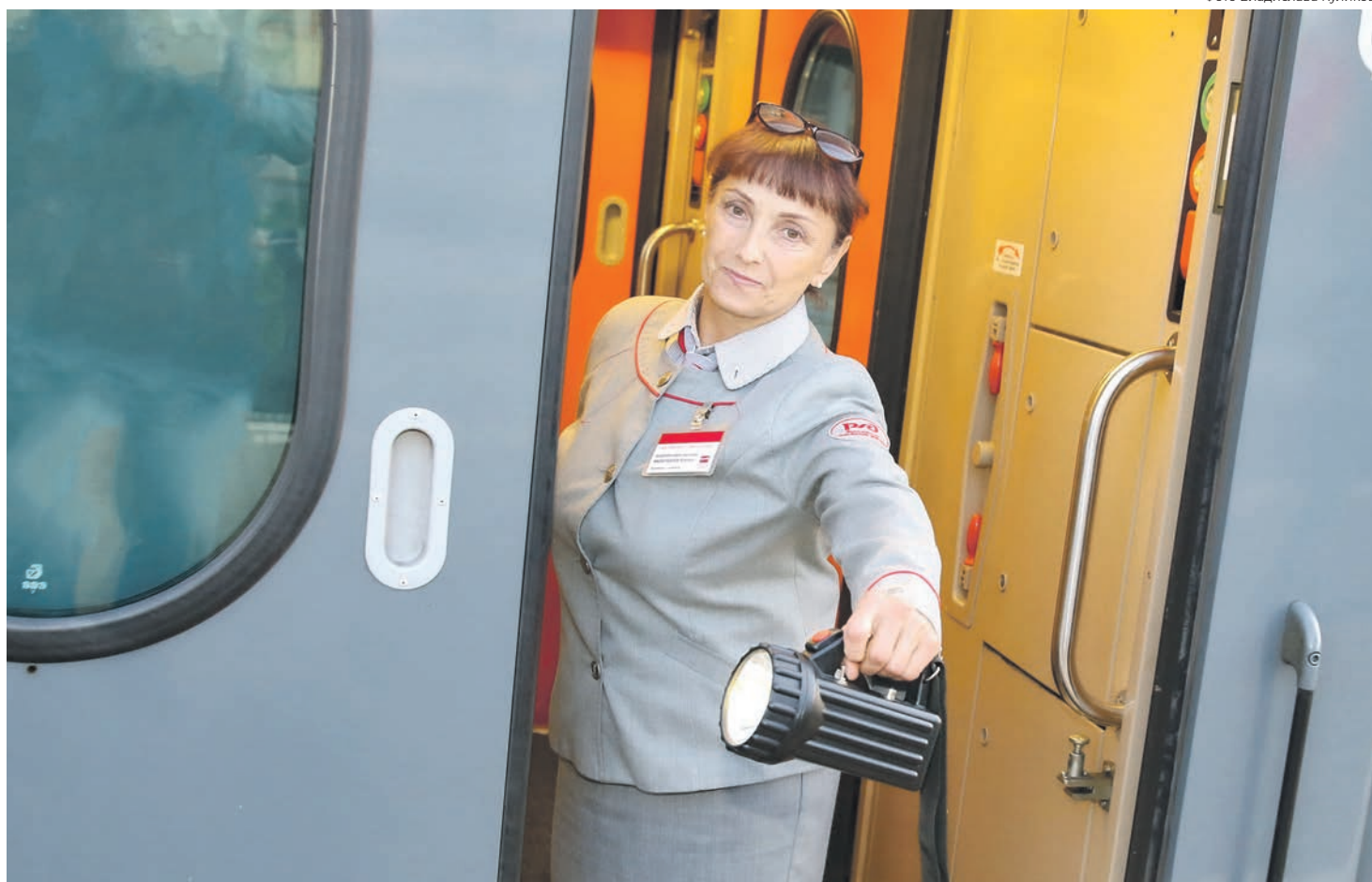
Коллективный договор «дочки» РЖД — Федеральной пассажирской компании — тоже участвует в конкурсе