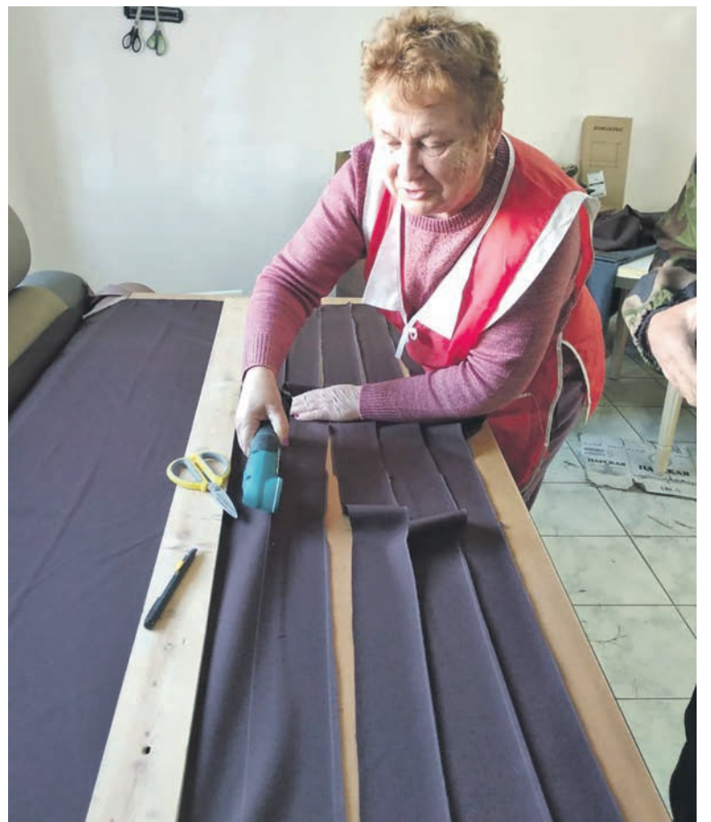
Ветераны станции Находка-Восточная передали в пункт сбора гуманитарной помощи поселка Врангель очередную партию окопных свечей и маскировочных сетей, сделанных своими руками