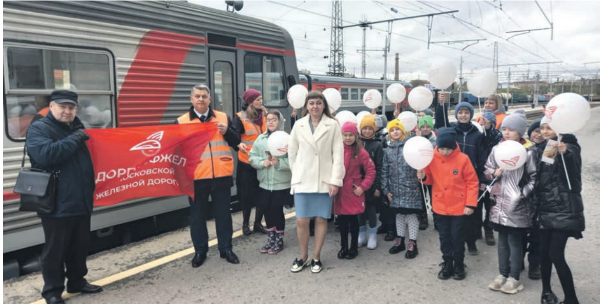
Представители Рязанского регионального обособленного подразделения Дорпрофжел на МЖД провели урок безопасности для учащихся школы № 43, посвященный правилам нахождения на объектах железнодорожного транспорта