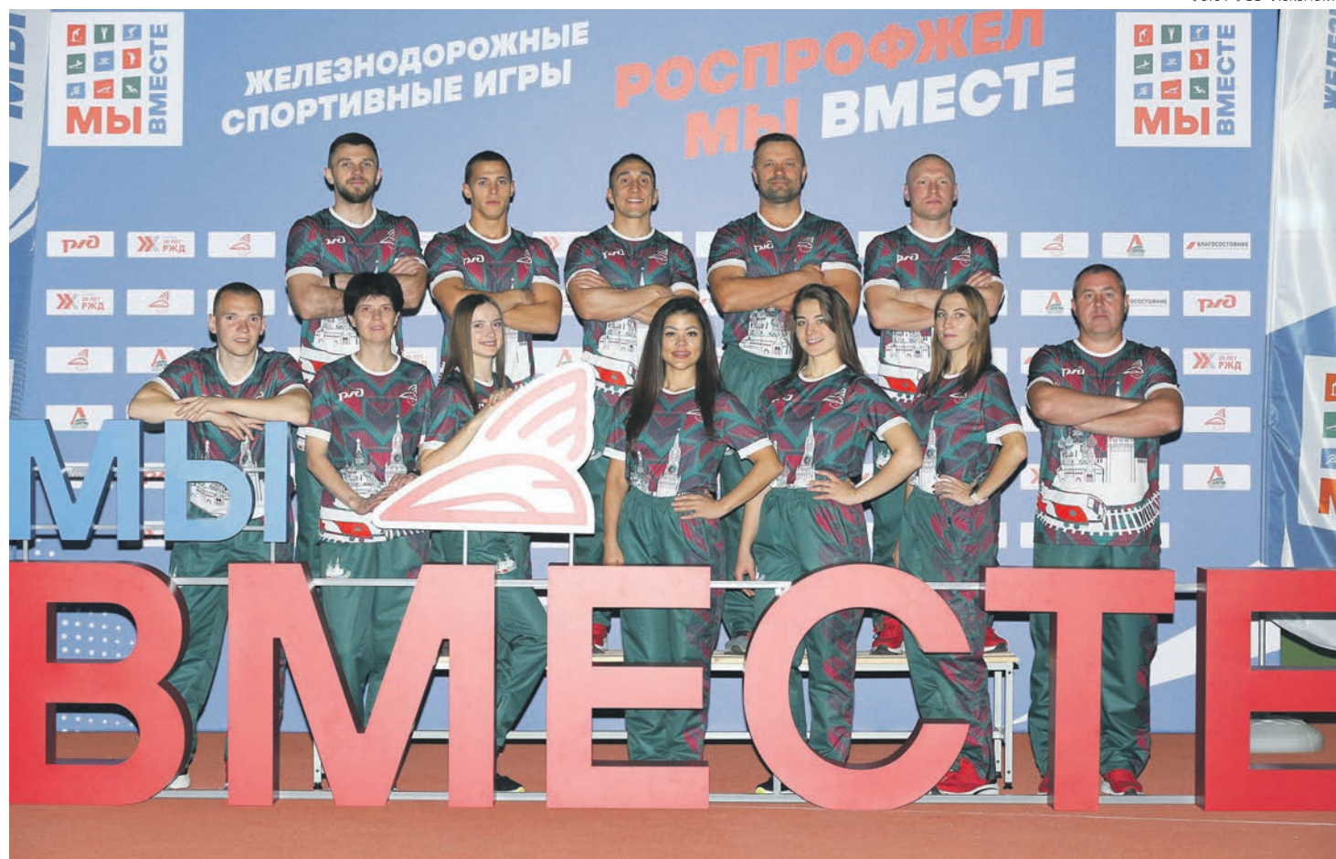
Команда Московской железной дороги забрала главный трофей