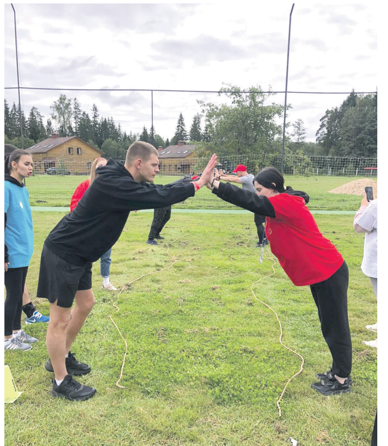
В Тверской области прошел первый слет молодежи АО «Московско-Тверская пригородная пассажирская компания», организованный профсоюзом и молодежным комитетом