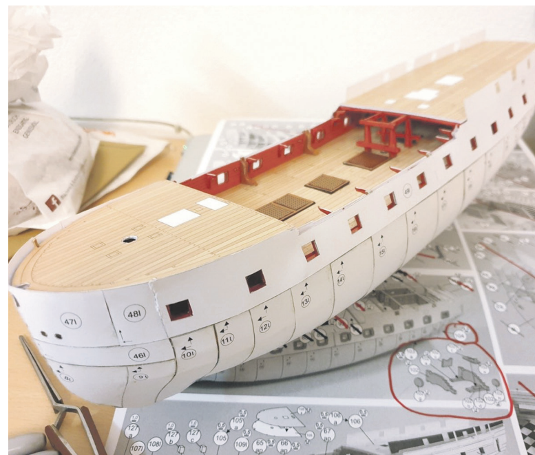
Максим с ребятами создает модели из бумаги и пластика

«Я провожу с воспитанниками детских домов мастер-классы по созданию моделей из бумаги и пластика, — продолжает Максим. — Многих ребят это занятие увлекло, у них получаются интересные модели. В начавшемся учебном году будем это дело продолжать».