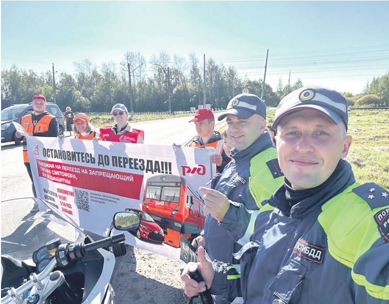
На переезде перегона Гжель — Куровская МЖД волонтеры и профактивисты провели акцию «Внимание, переезд!»