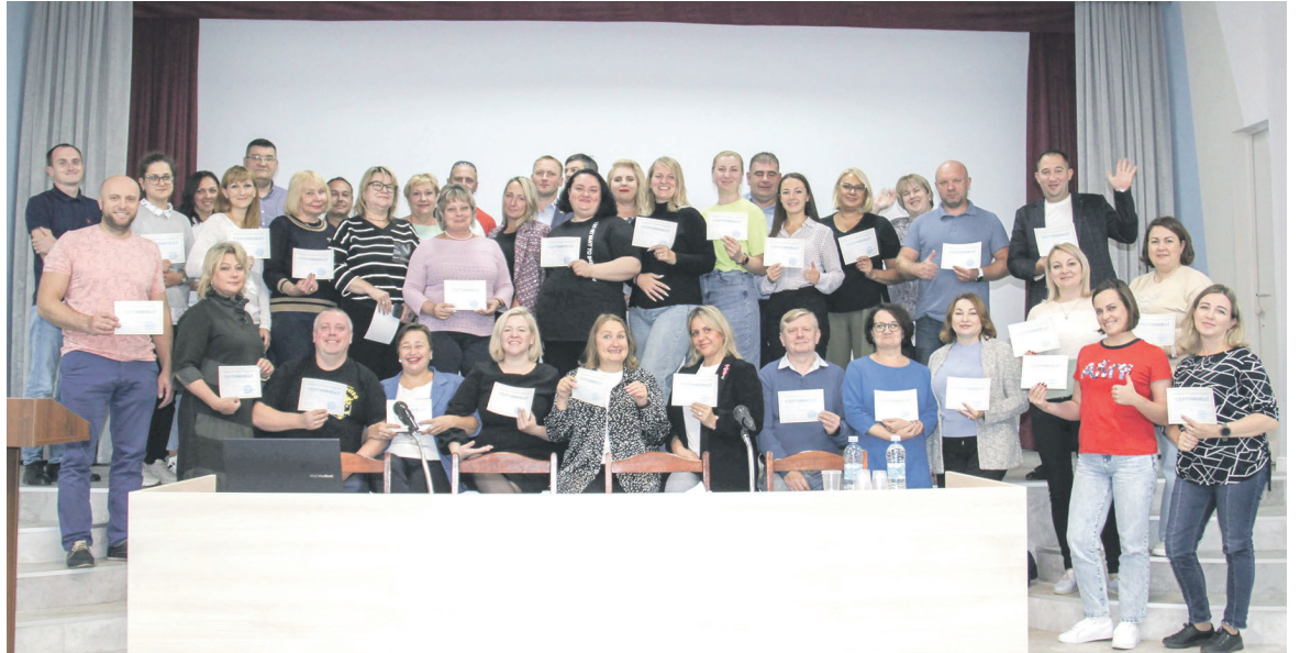
Профактив Дорпрофжел Московского метрополитена стал участником интенсива по социальному проектированию