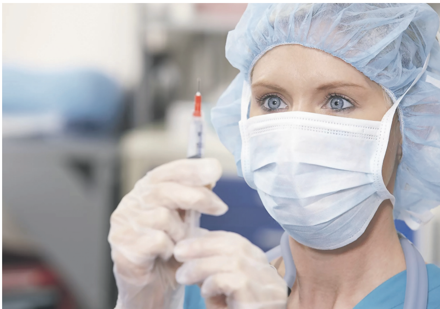
Роспотребнадзор напоминает, что пора делать прививки от гриппа