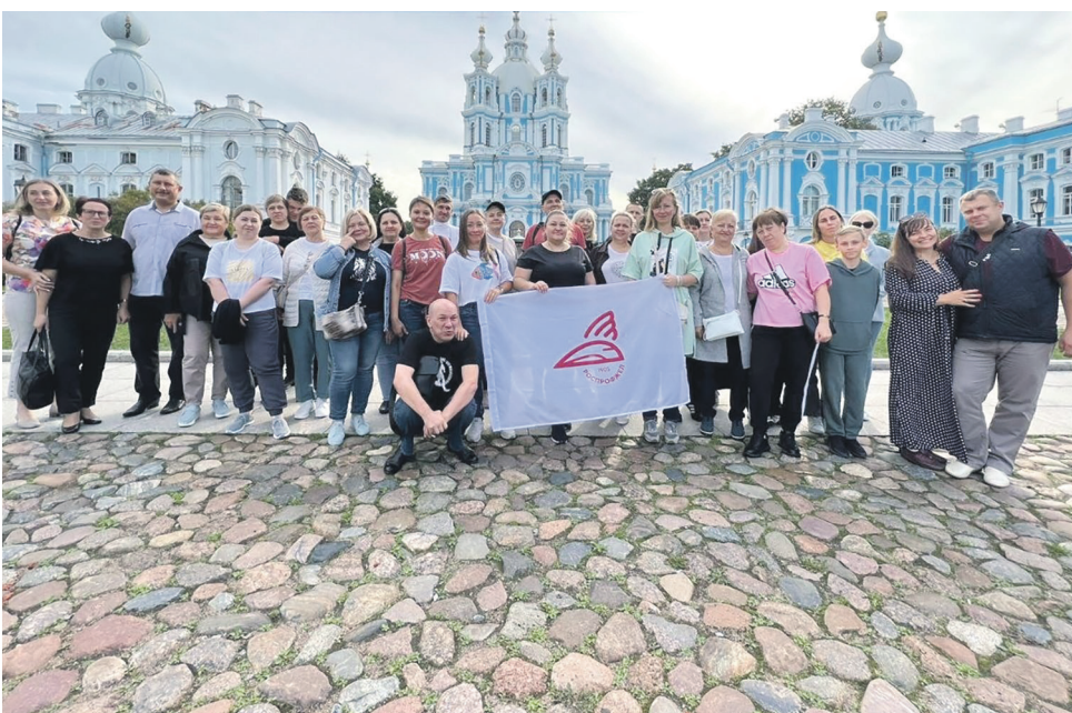
Профком Юго-Восточной дирекции управления движением организовал для членов профсоюза экскурсию в Санкт-Петербург