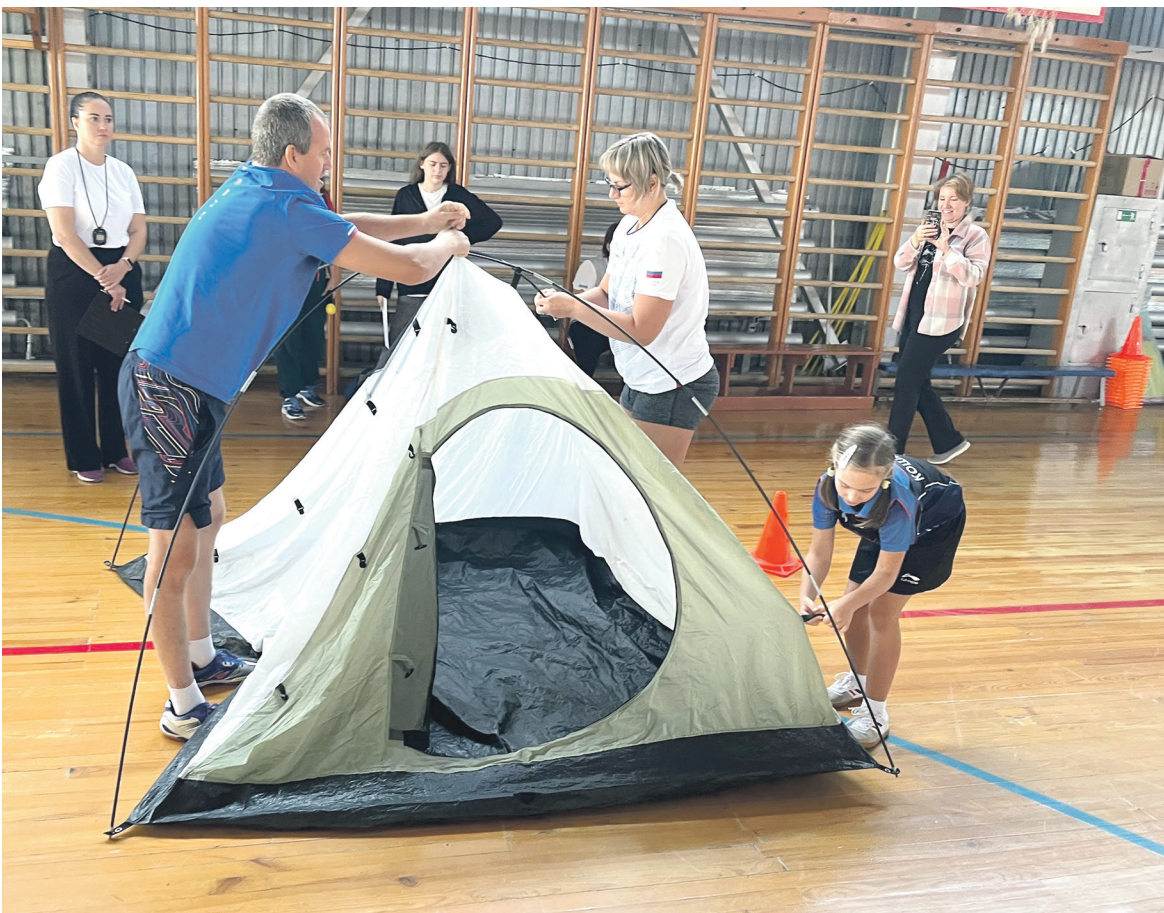
Оренбургский филиал Дорпрофжел на ЮЖД и РКСО «Локомотив» провели в Орске семейный спортивный праздник «Туриада-2023»