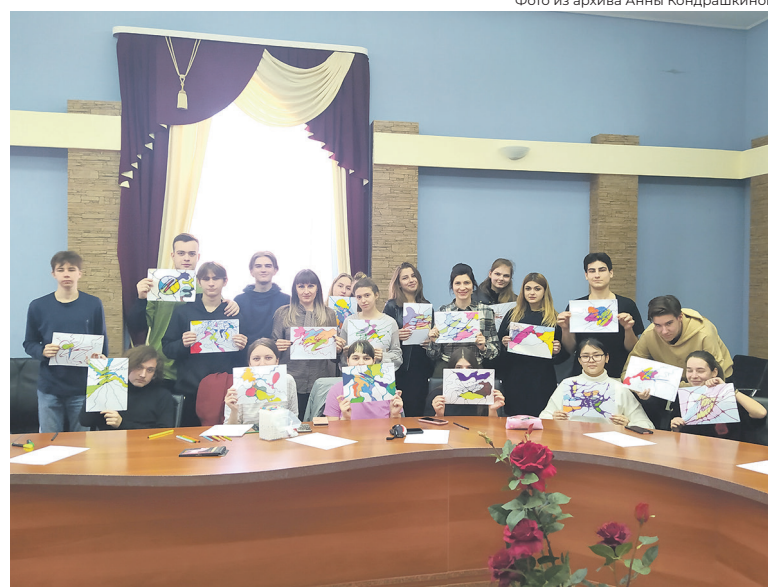
Групповые тренинги также помогают разобраться в себе

— Опять же помогает эмпатия. Кажется, что понимать и принимать чужие эмоции тяжело, но на самом деле людям сочувствующим легче справляться с собственными эмоциями. Кроме того, эмпатия помогает