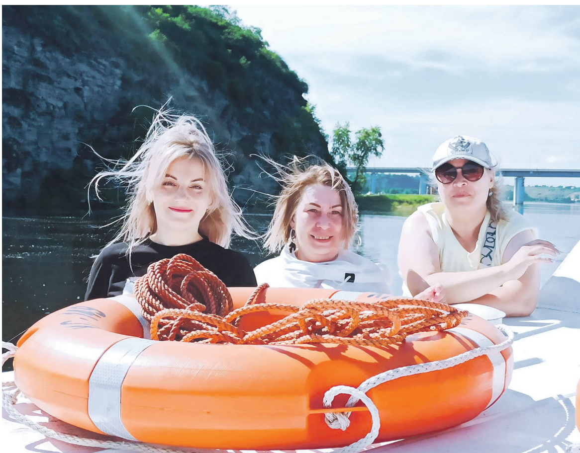
Работники АО «Краспригород» Абаканского узла отправились на прогулку на катере по Енисею