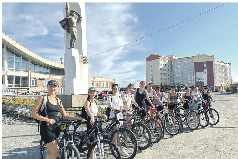
В Северобайкальске прошел женский велопробег, вместе работницы РЖД проехали 180 км