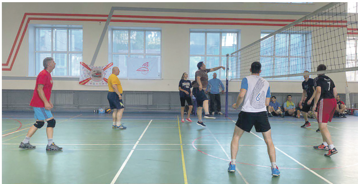
При поддержке первичной профсоюзной организации ТЧЭ-2 Омск в Доме спорта прошли соревнования по волейболу среди работников эксплуатационного локомотивного депо Омск