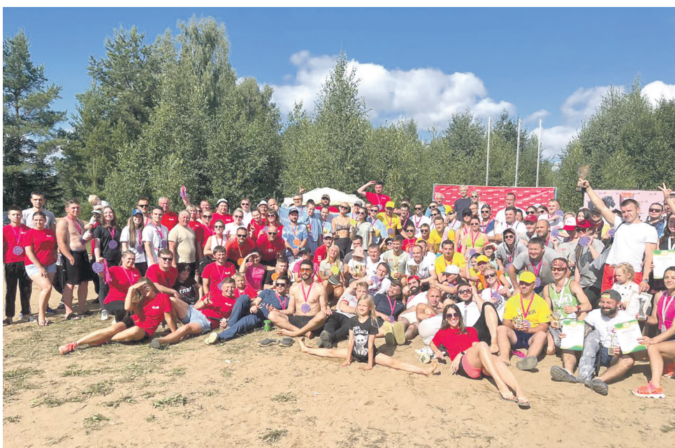
11 летний Турслет Октябрьской железной дороги состоялся при поддержке Дорпрофжел на ОЖД