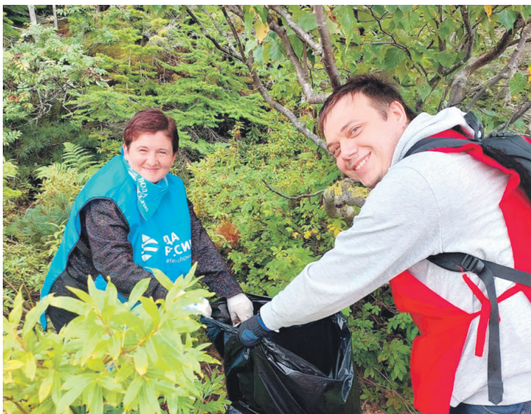
Волонтеры-железнодорожники Дальневосточной дороги приняли участие в очередной экологической акции «Вода России» и убрали берег озера Русского в Корсаковском районе