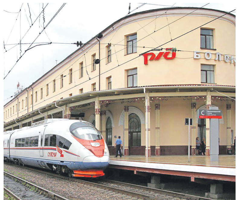
На станции Бологое построили вокзал второго класса

А в будущем главы многих городов и губерний будут считать вопросом престижа наличие вокзала именно I класса.