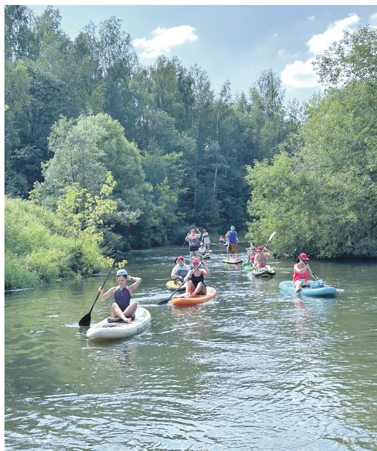
Цеховая профсоюзная организация органа управления Дирекции тяги организовала для членов профсоюза 15-километровый сплав на сапах по реке Истра