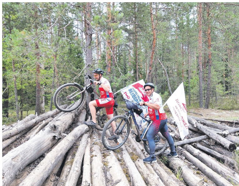
Велосипедисты авангарда МЖД во время велопробега, посвященного 78-й годовщине Победы в Великой Отечественной войне, побывали в самом древнем городе-крепости Верховоложья — Торпце