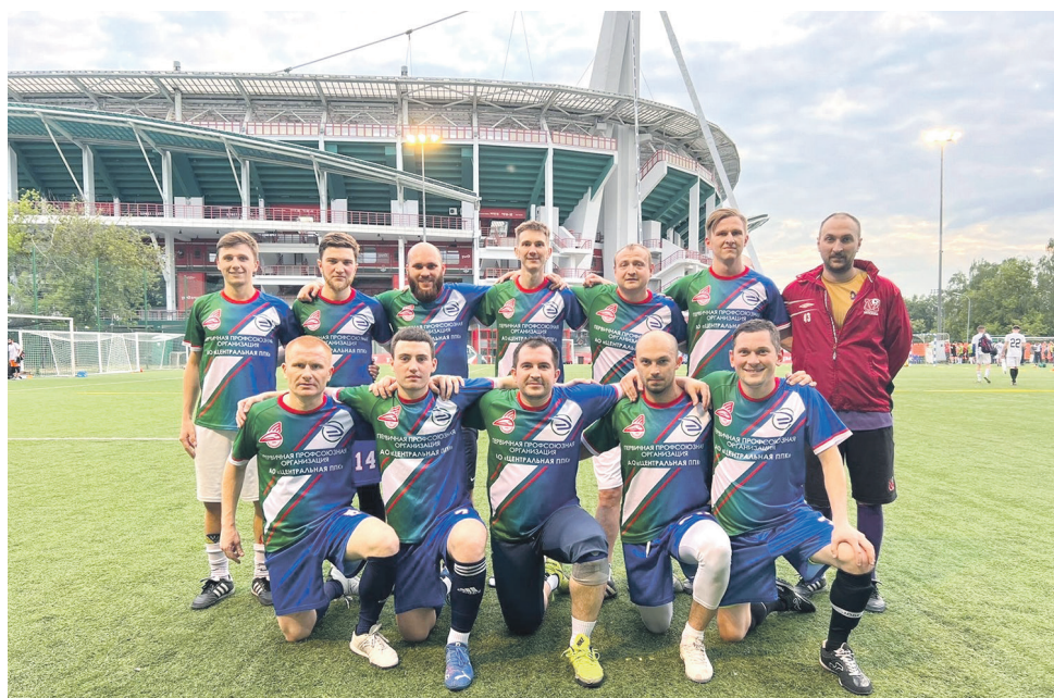
Команда ППО ЦППК стала участником турнира по футболу в рамках празднования Дня Московского транспорта