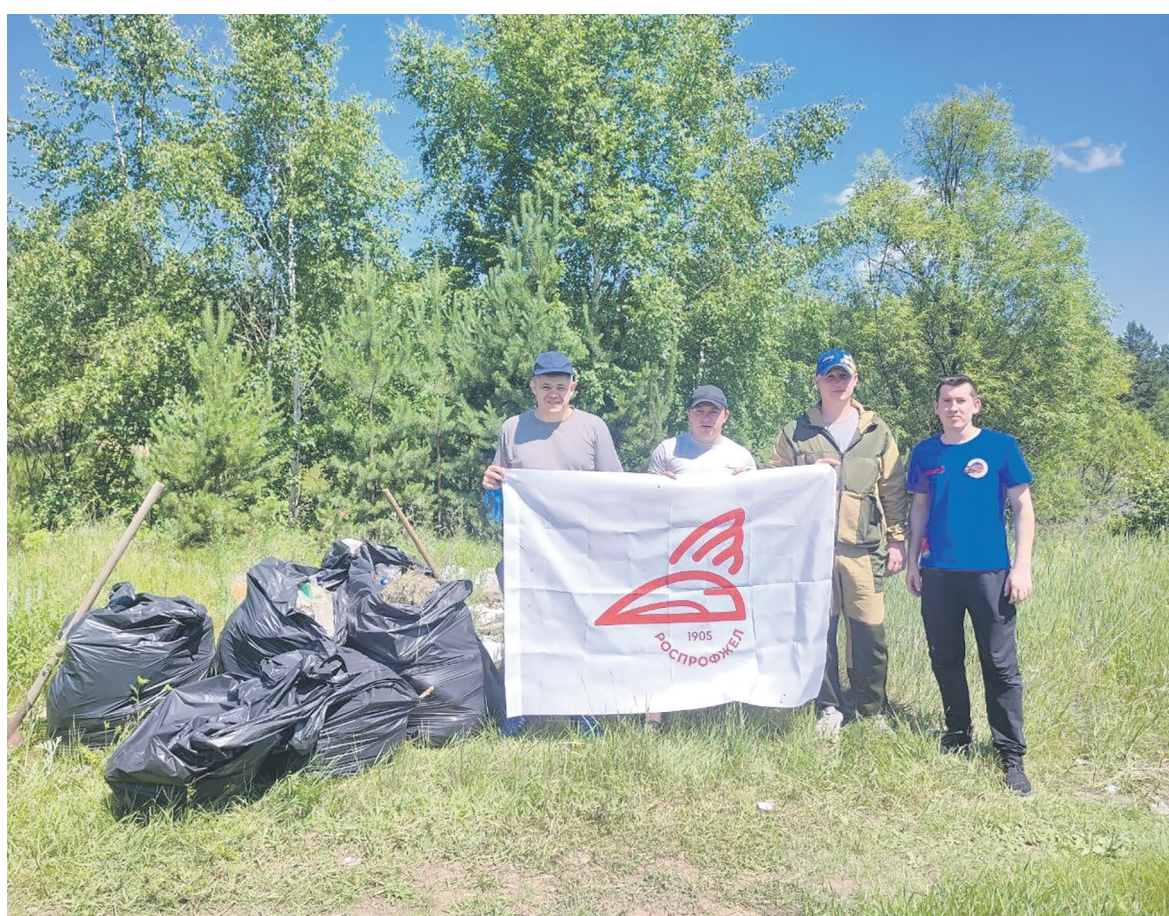
Представители Забайкальской дирекции тяги показали свою приверженность к экологическим ценностям, организовав субботник на берегу озера Затон