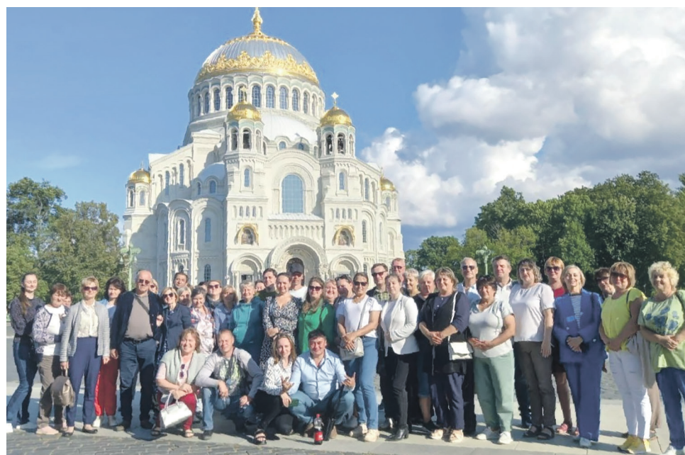
200 членов профсоюза с ОЖД побывали в Кронштадте. Помимо достопримечательностей города — Морского собора, Якорной площади и парка, участники мероприятия посетили «Остров Форт»