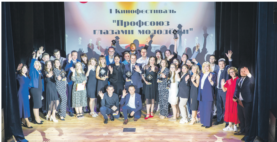
В Ярославле состоялся I кинофестиваль «Профсоюз глазами молодежи», воплощенный молодыми активистами при поддержке Дорпрофжел на СЖД