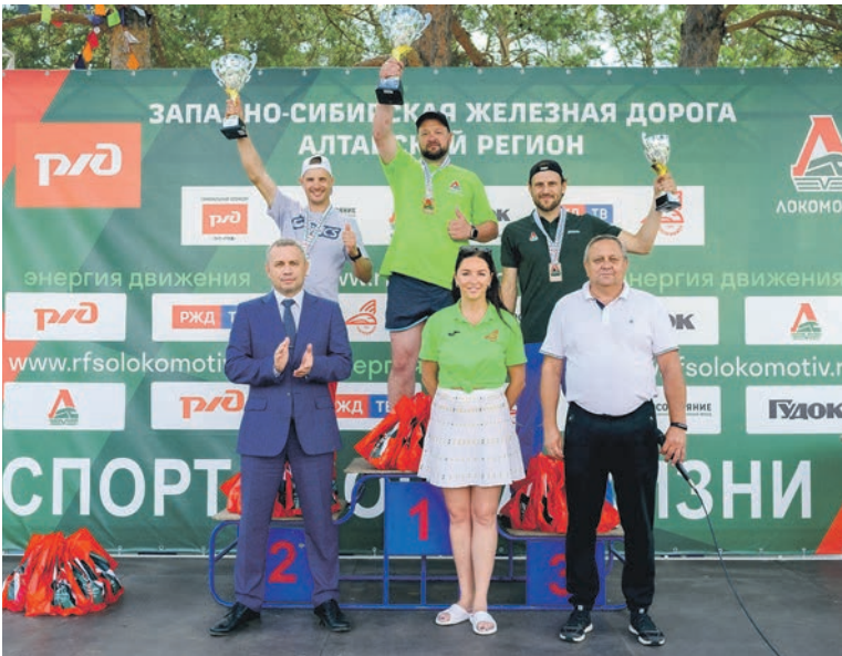
В Барнауле состоялась летняя спартакиада работников Западно-Сибирской железной дороги