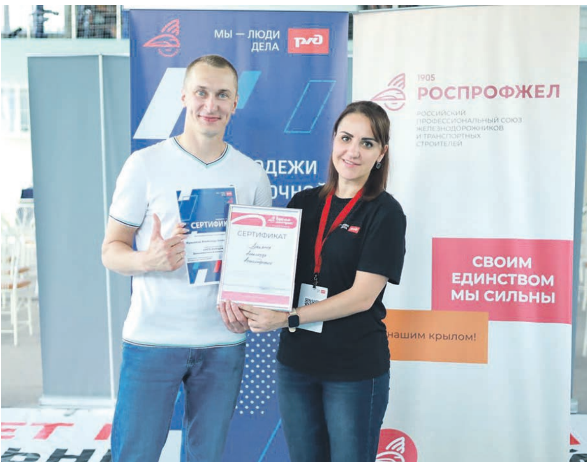
На ДВЖД состоялся дорожный этап программы РОСПРОФЖЕЛ «Время молодых. Работники»