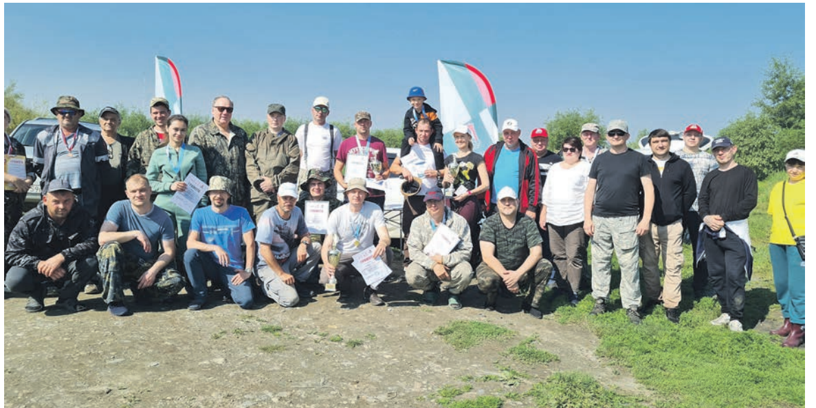
Три десятка рыбаков — работников ВСЖД стали участниками профсоюзных соревнований по рыбной ловле с берега