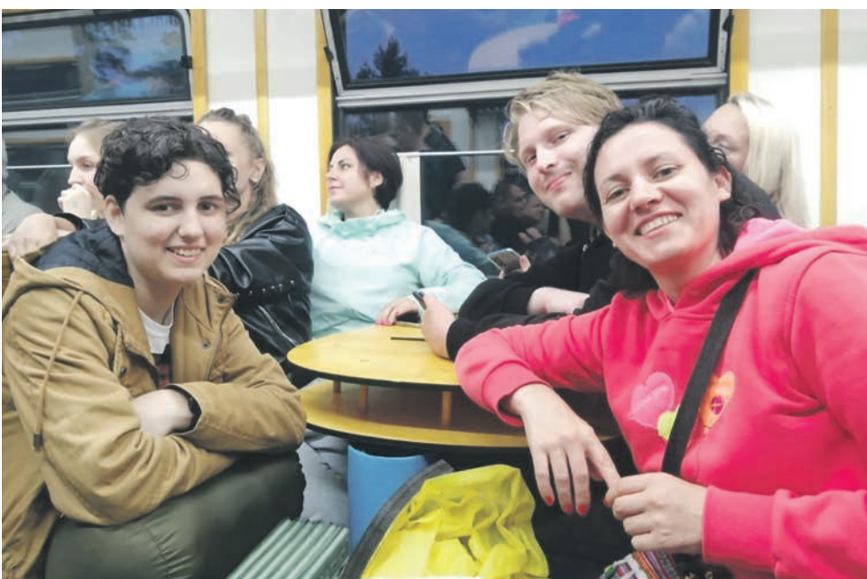
В Самарской области прошел Грушинский фестиваль, среди участников которого было немало железнодорожников, и не только зрителей, но и волонтеров. Добраться на фестиваль им помогли профсоюзные организации