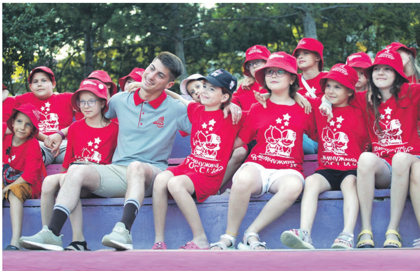
Школьникам запомнятся тематические «профсоюзные» дни