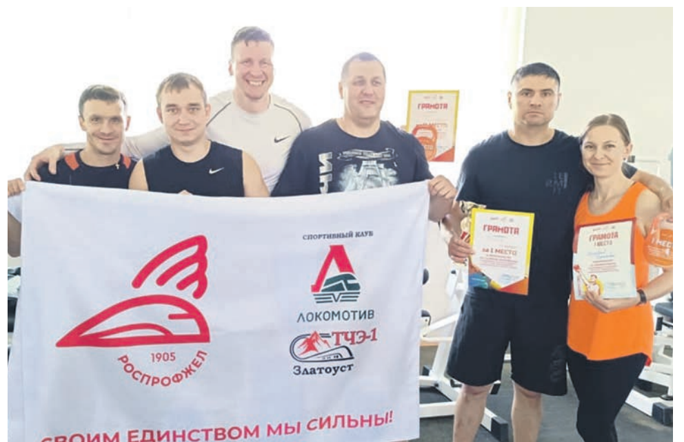
В Златоусте прошли соревнования по силовому многоборью среди работников Златоустовского территориального управления ЮУЖД