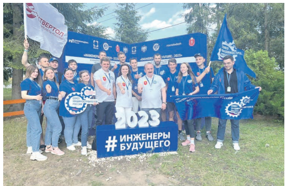
Команда Ростовского электровозоремонтного завода стала участником Международного форума «Инженеры будущего — 2023»