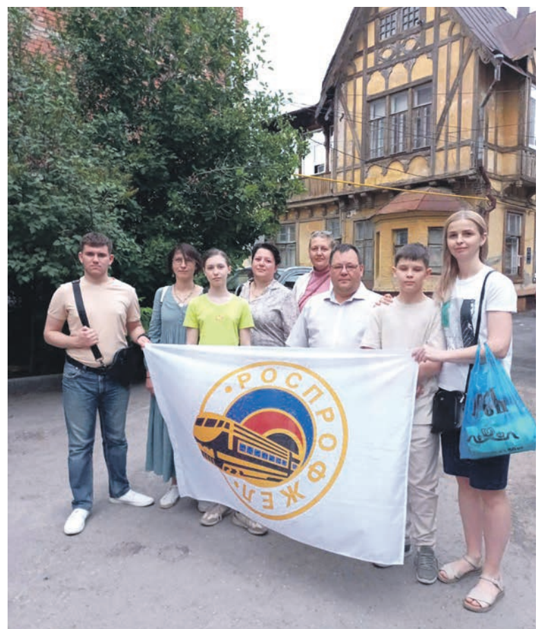
Пешие экскурсии по старым улицам и дворикам Самары организовал профком Самарского информационно-вычислительного центра