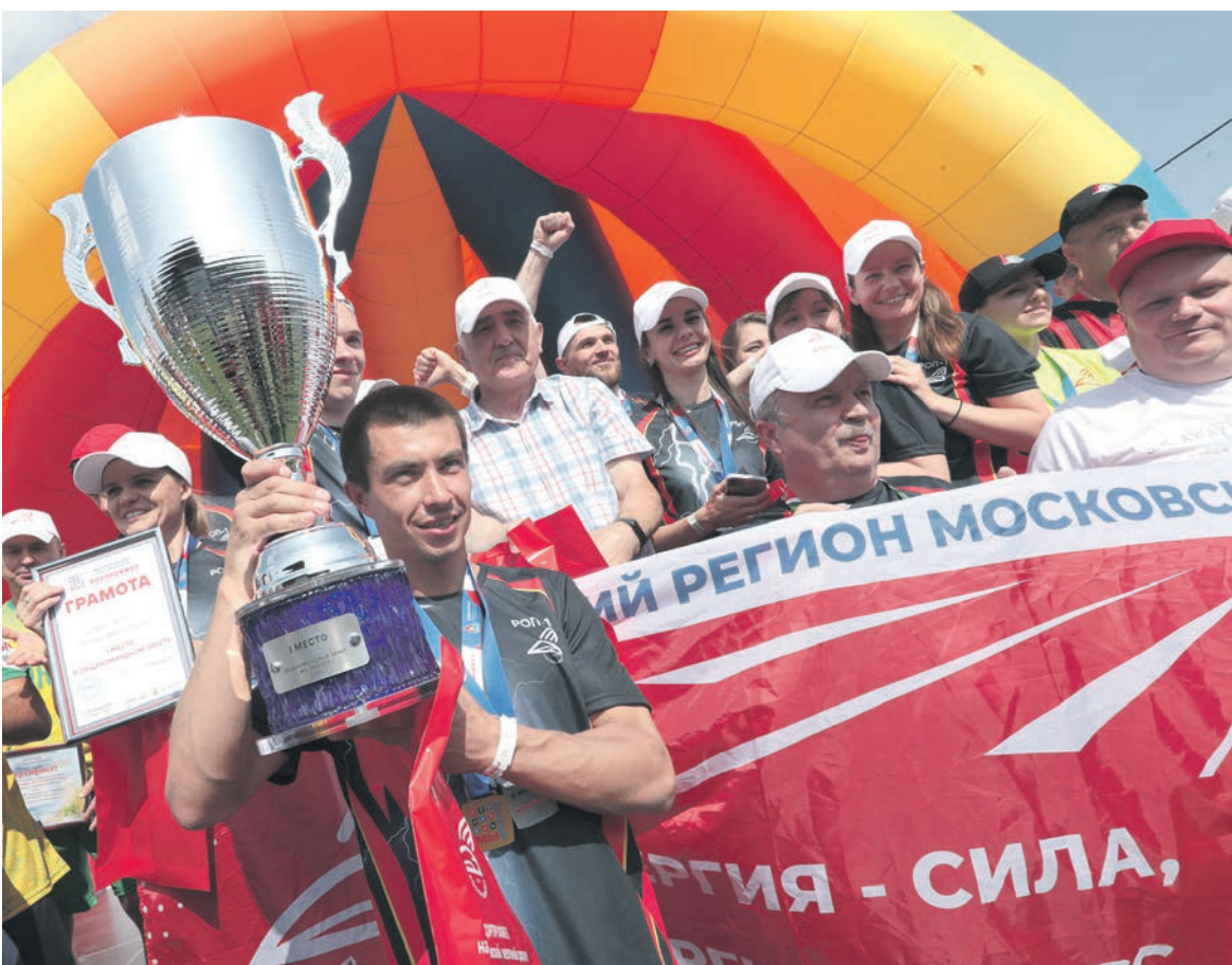
На полигоне Московской магистрали завершился второй этап Железнодорожных спортивных игр РОСПРОФЖЕЛ «Мы вместе»