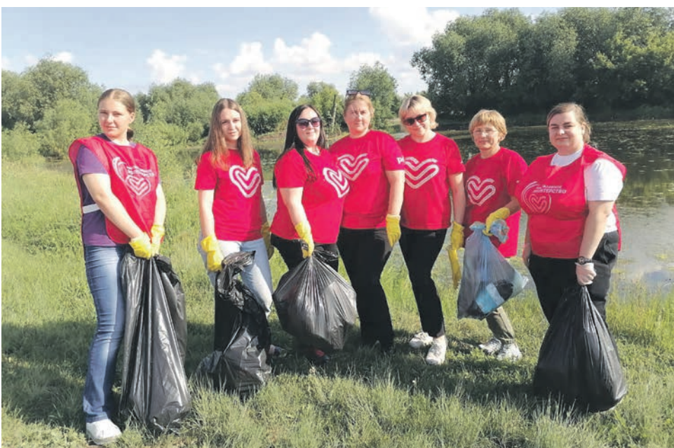
Профактив и волонтеры Беловского узла ЗСЖД очистили берег Беловского водохранилища в рамках акции «Чистый берег»