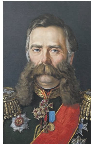
Граф Алексей Бобринский

Весной 1872 года министр путей сообщения граф Алексей Бобринский в первый и единственный раз поспорил с императором Александром II. Ему самому это, конечно, стоило карьеры. Но для инженера, которого он встретил на вокзале Царского Села, сразу после ссоры с царем, история стала «счастливым билетом» к богатству.