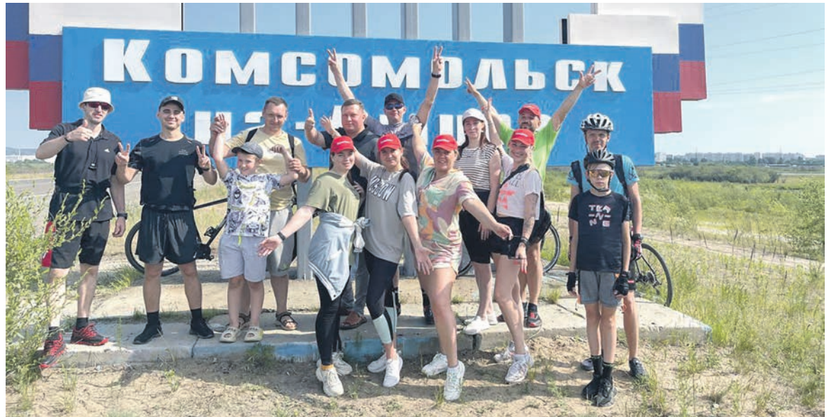
Первичка сервисного локомотивного депо Амурское организовала велопробег, посвященный 11-летию компании «Локо-Тех» и 50-летию БАМа