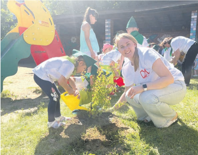
В рамках эстафеты «Паровозик эколят» Молодежный совет Иркутского филиала Дорпрофжел на ВСЖД провел экологическую акцию в детском саду № 220 ОАО «РЖД»