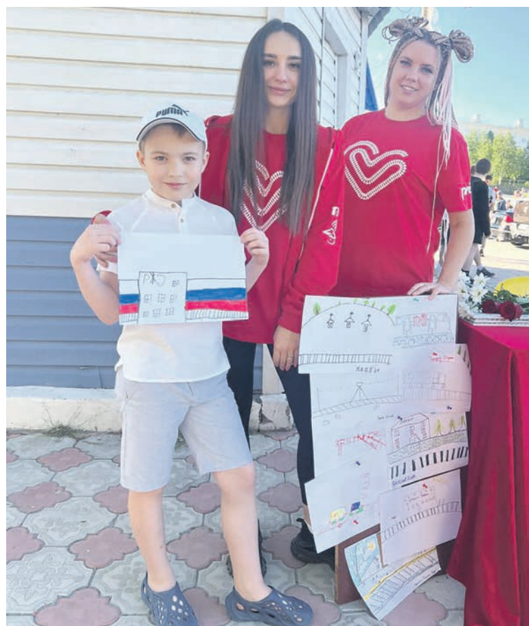
В день празднования Дня молодежи Тындинский совет молодежи ДВЖД организовал познавательную площадку на площади БАМа