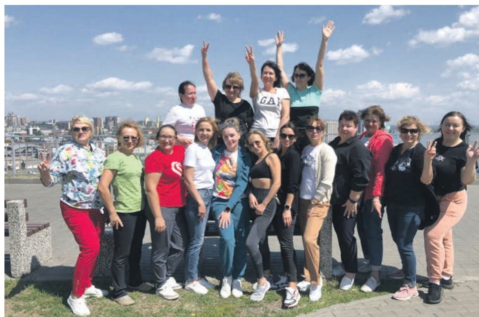
Участницы проекта «Время женщин», организованного Алтайским подразделением Дорпрофжел на ЗСЖД, получили новые знания