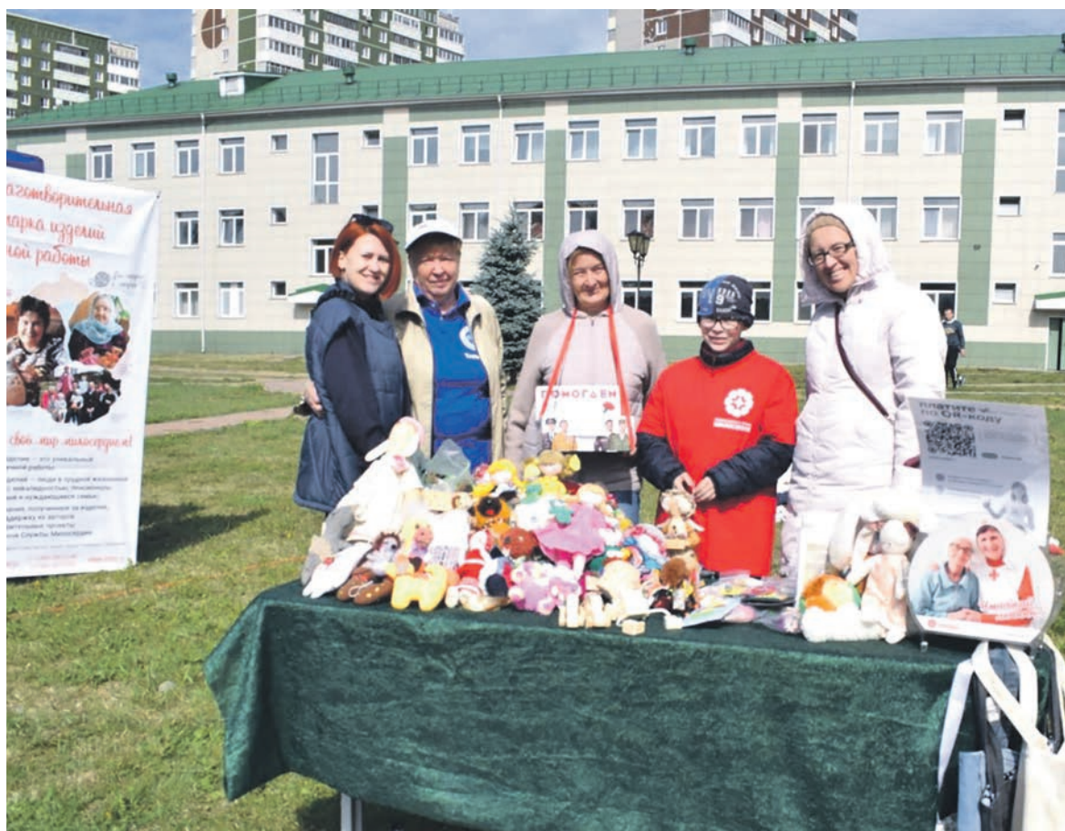
Волонтеры Дорпрофжел на СвДЖ совместно с православной службой милосердия провели благотворительную ярмарку