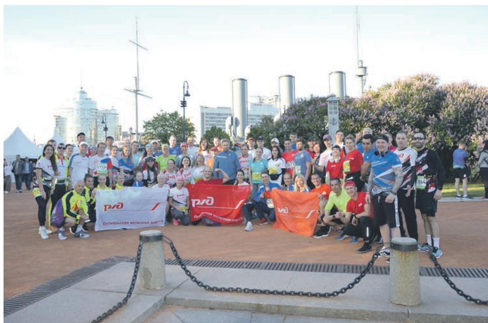
На старт Международного марафона «Белые Ночи» вышли более 110 работников Октябрьской железной дороги — членов РОСПРОФЖЕЛ