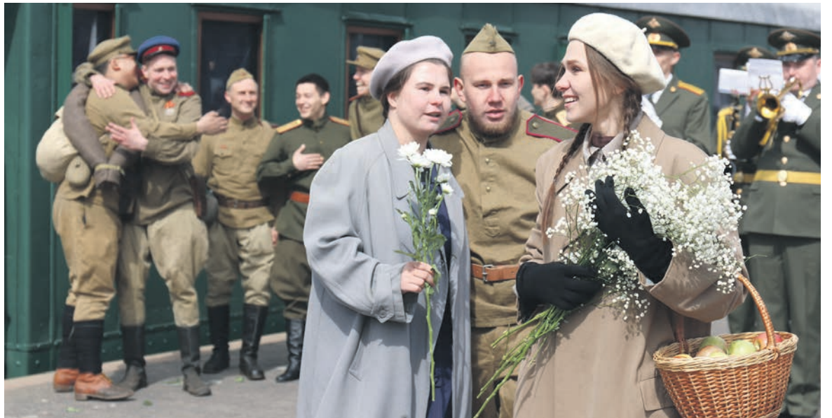
На Финляндском вокзале Санкт-Петербурга реконструировали встречу прибывшего в послевоенный Ленинград поезда с фронтовиками