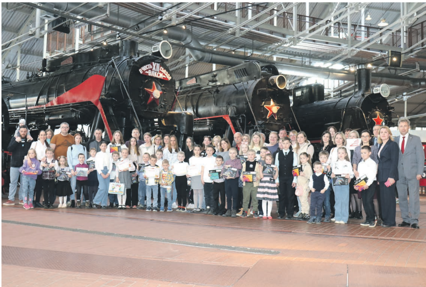
Награды победителям онлайн-конкурса детского творчества вручали в торжественной обстановке