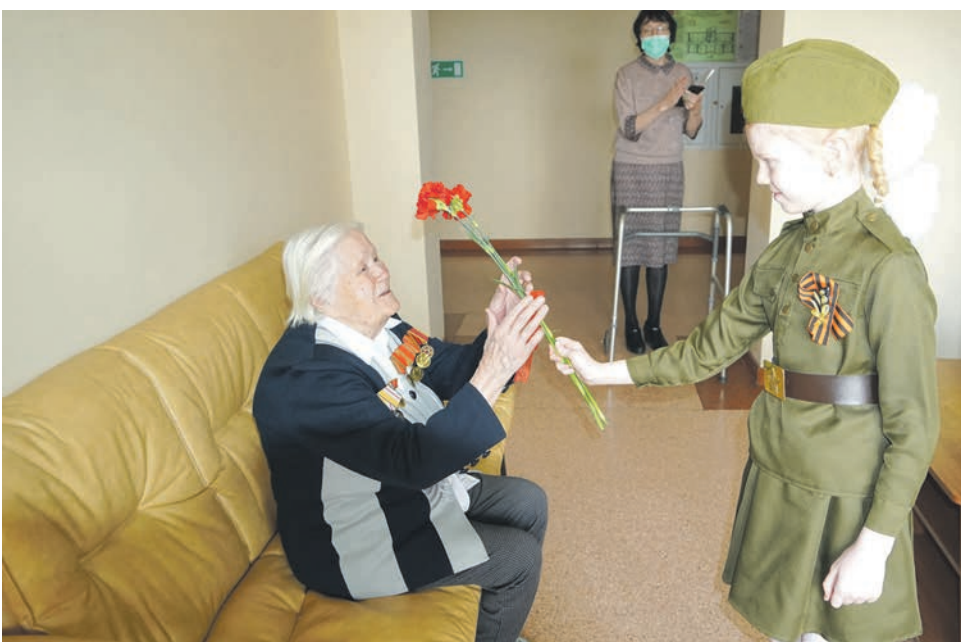
Представители коллектива Дальневосточной дирекции по ремонту пути поздравили с Днем Победы тружениц тыла, проживающих в Хабаровске в Краевом доме для ветеранов Великой Отечественной войны