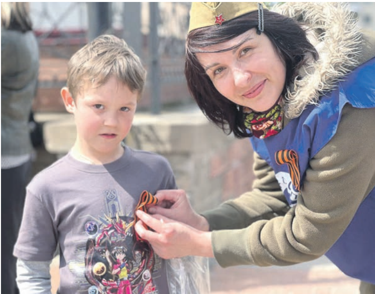
Профсоюзные активисты и волонтеры провели акцию «Георгиевская ленточка» на вокзале станции Белгород Юго-Восточной железной дороги