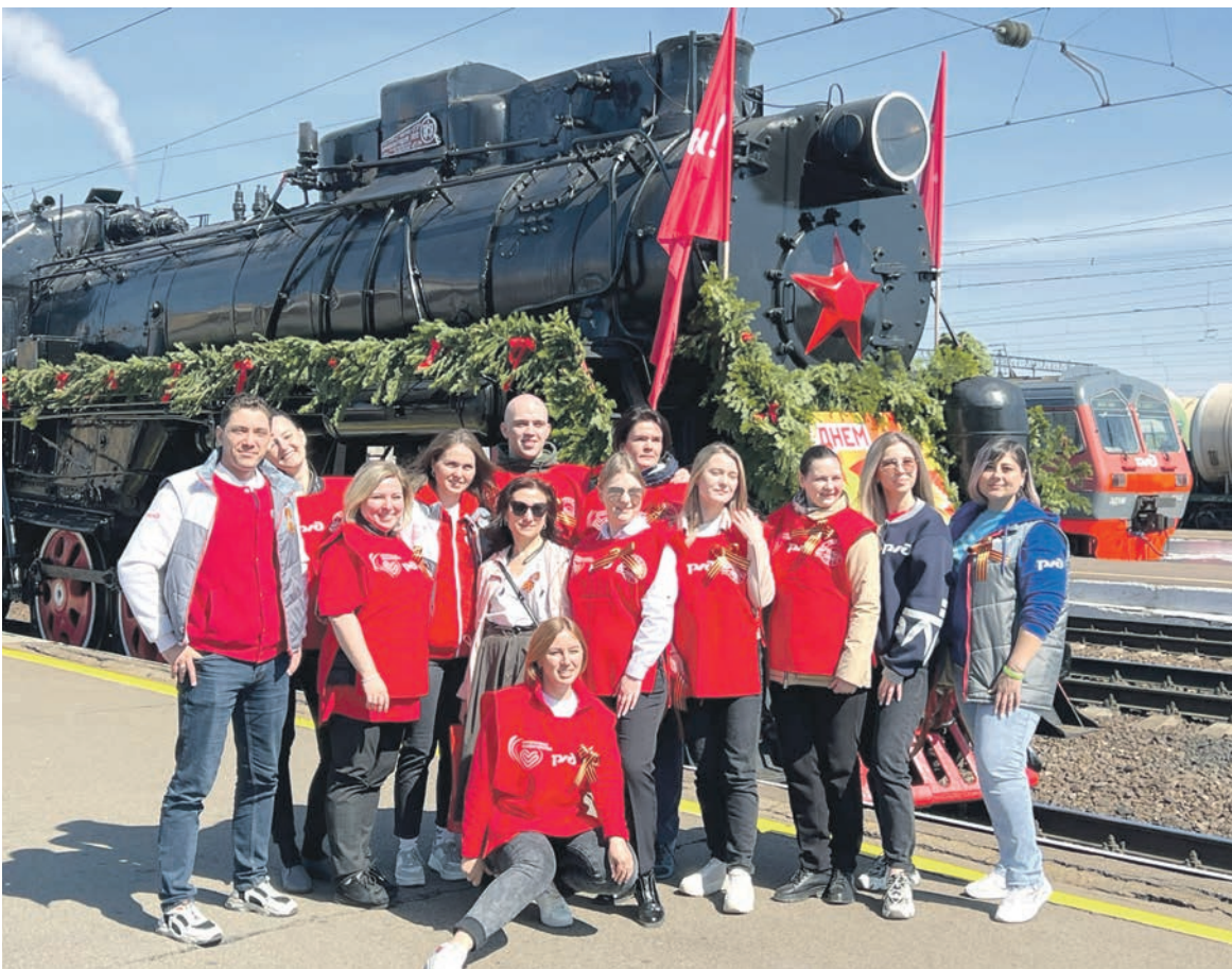
Традиция запуска настоящего паровоза времен Великой Отечественной войны на Восточно-Сибирской дороге зародилась около двух десятков лет назад. Накануне Дня Победы Иркутский и Улан-Удэнский узлы дороги в очередной раз приветствовали праздничный состав — Поезд Победы