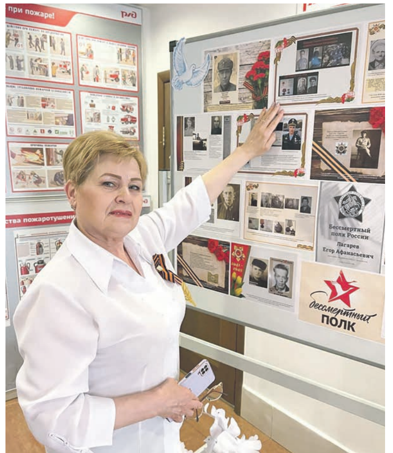
В ОАО «Центр корпоративного учета и отчетности «Желдоручет» провели акцию «Бессмертный полк», создав стенд с фотографиями участников ВОВ — родственниками работников предприятия