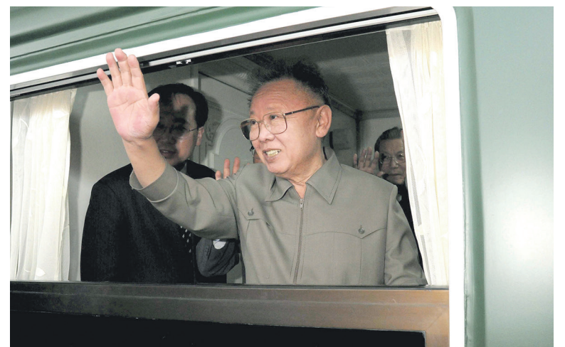
24 дня лидер КНДР путешествовал по просторам России

А 18 августа состав вернулся на станцию Хасан в Приморском крае. Российские вагоны отцепили от корейских, после чего состав проехал немного вперед, и электровоз затормозил на Мосту дружбы, три пролета которого — российские, шесть — северокорейские. Так закончился 24-дневный визит тогдашнего лидера КНДР в Россию.