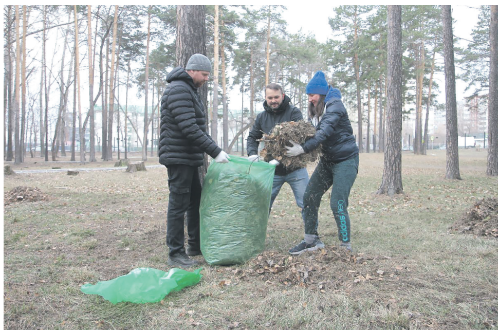
В Екатеринбурге первый субботник железнодорожников состоялся на стадионе «Локомотив»