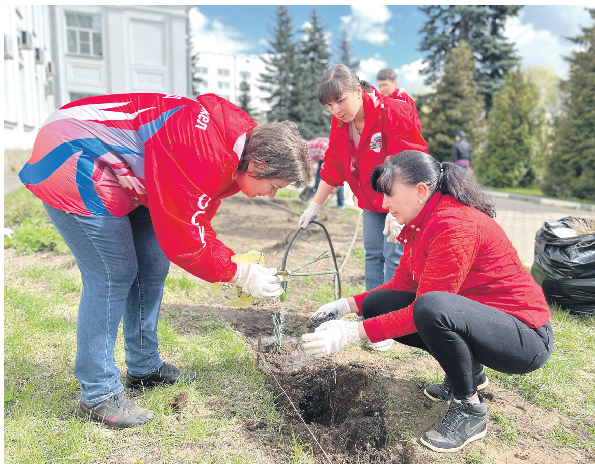
Работники аппарата Дорпрофжел на МЖД приняли участие в субботнике на территории клинической больницы «РЖД» им. Н.А. Семашко