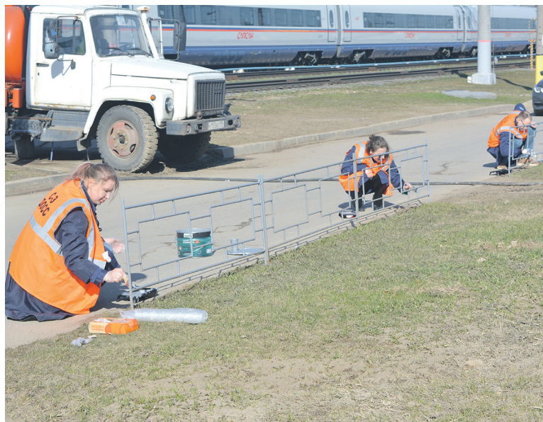
Работники Северо-Западной дирекции скоростного сообщения высадили деревья и кустарники, облагородили клумбы с цветами, выполнили покрасочные работы и привели в порядок территорию