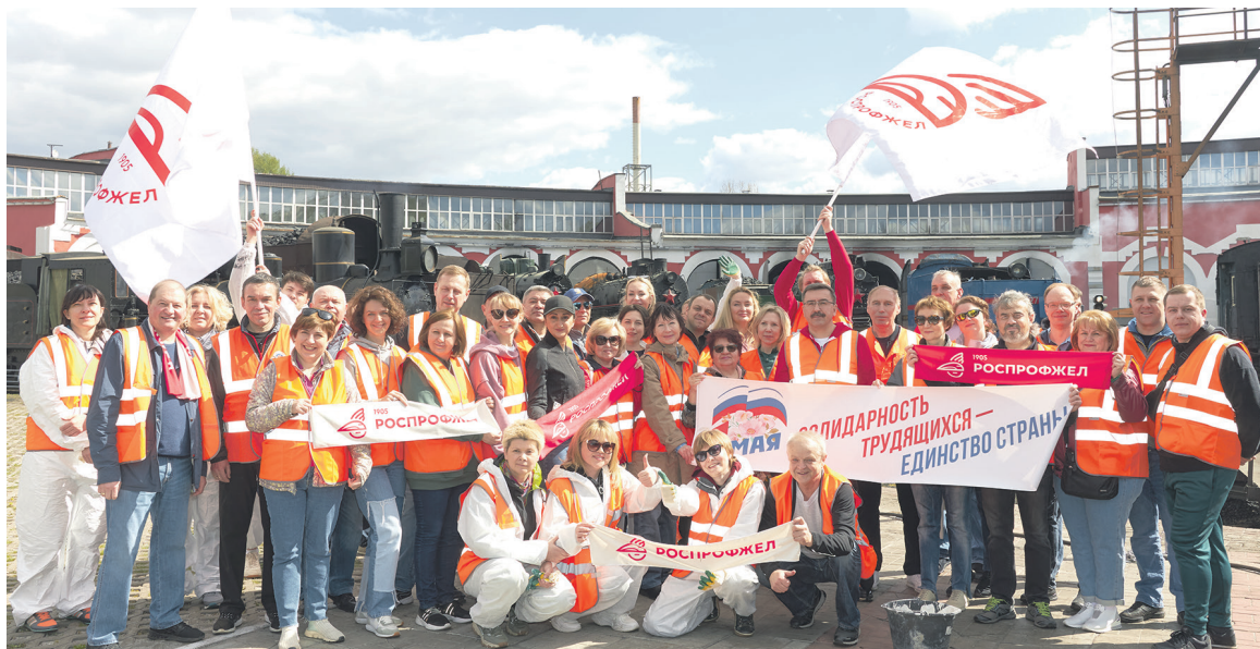
Работники аппарата ЦК РОСПРОФЖЕЛ приводили в порядок историческую площадку «Паровозное депо Подмосковная»