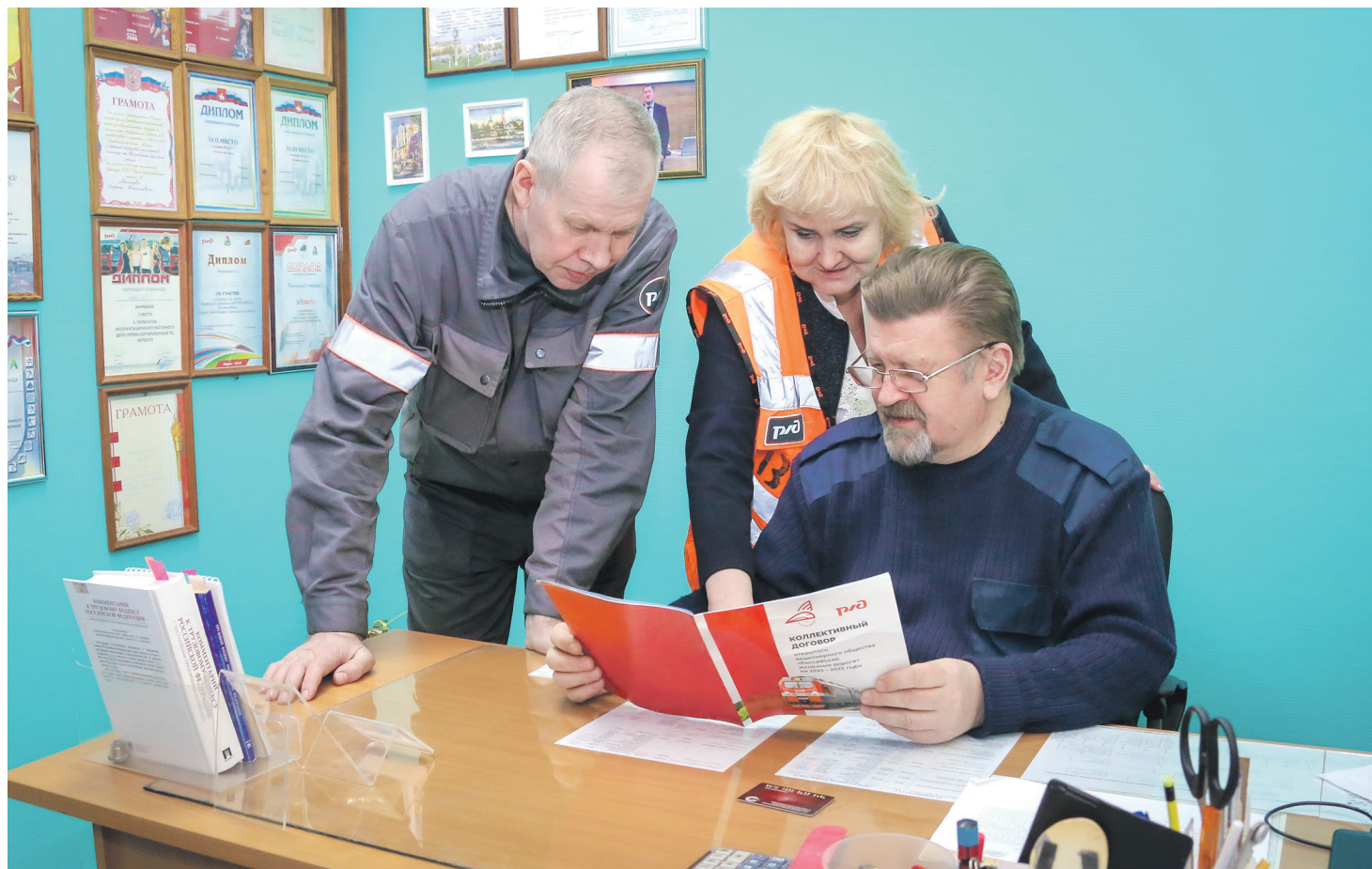
Общественный контроль помогает трудовым коллективам быть эффективнее