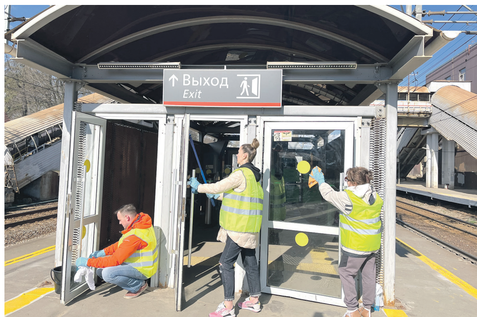
Сотрудники аппарата управления Московско-Тверской пригородной пассажирской компании убрали территорию от мусора, отмыли турникеты и кассовые павильоны