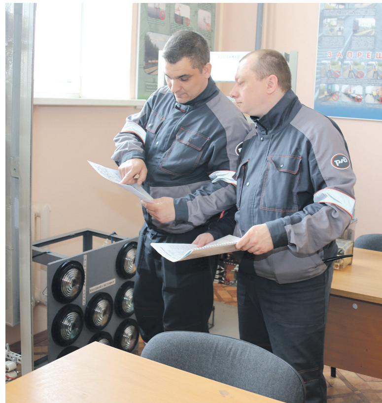
УЛОТ из первых рук получают информацию о том, что происходит на предприятии

Во-вторых, они имеют не только обязанности, но и права и гарантии своей деятельности. В соответствии с тем же Положением об уполномоченном (доверенном) лице по охране труда РОСПРОФЖЕЛ их можно