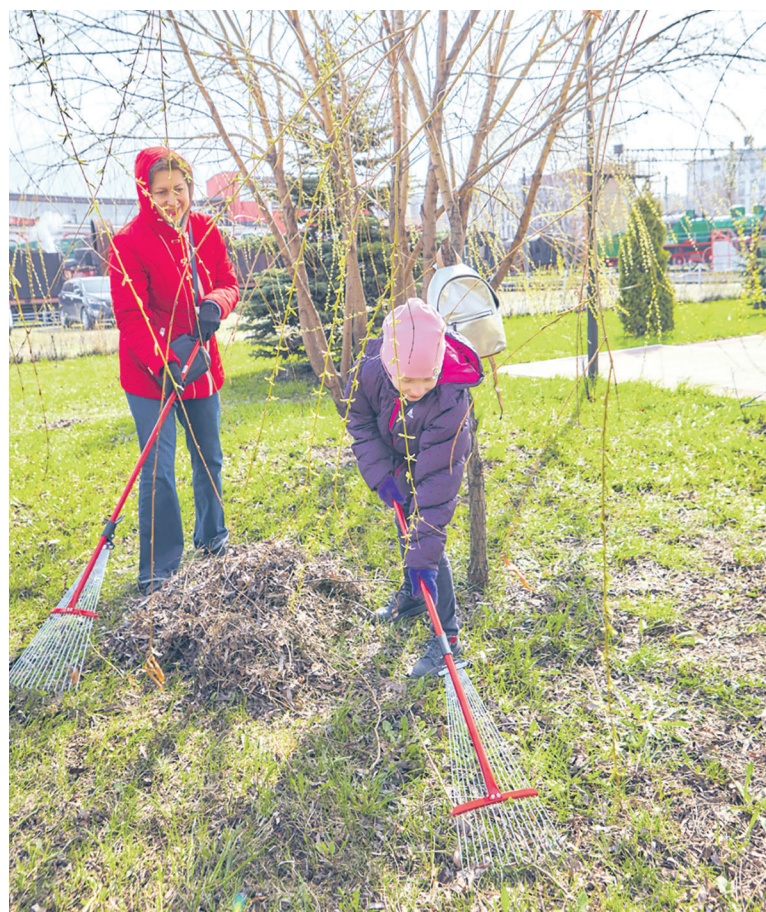
Сотрудники Федеральной грузовой компании пришли на весеннюю уборку с детьми