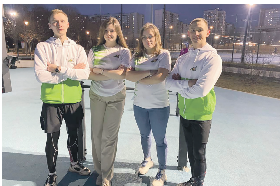
В Московско-Курском регионе МЖД открылся спортивный клуб для подготовки к гонкам с препятствиями. Его участники приступили к первым тренировкам