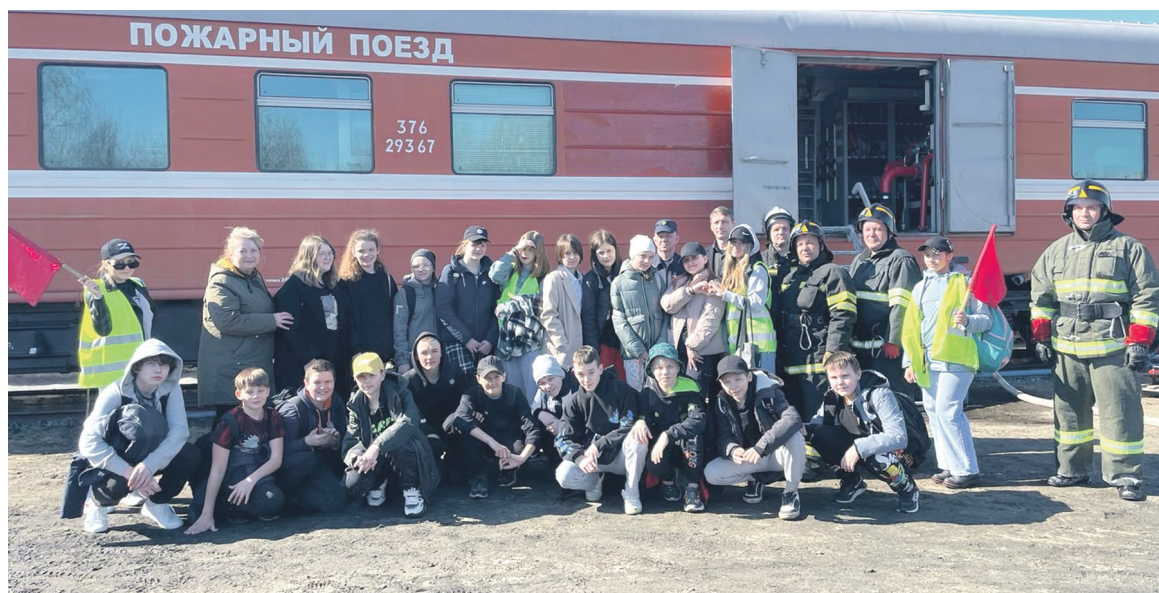
Учеников средней школы Медвежьегорска познакомили с работой пожарного поезда на Октябрьской железной дороге