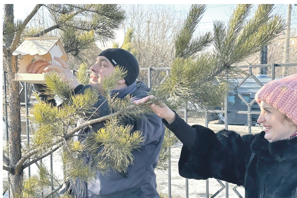
Работники эксплуатационного локомотивного депо Новокузнецк ЗСЖД изготовили и разместили на деревьях скворечники и кормушки для птиц