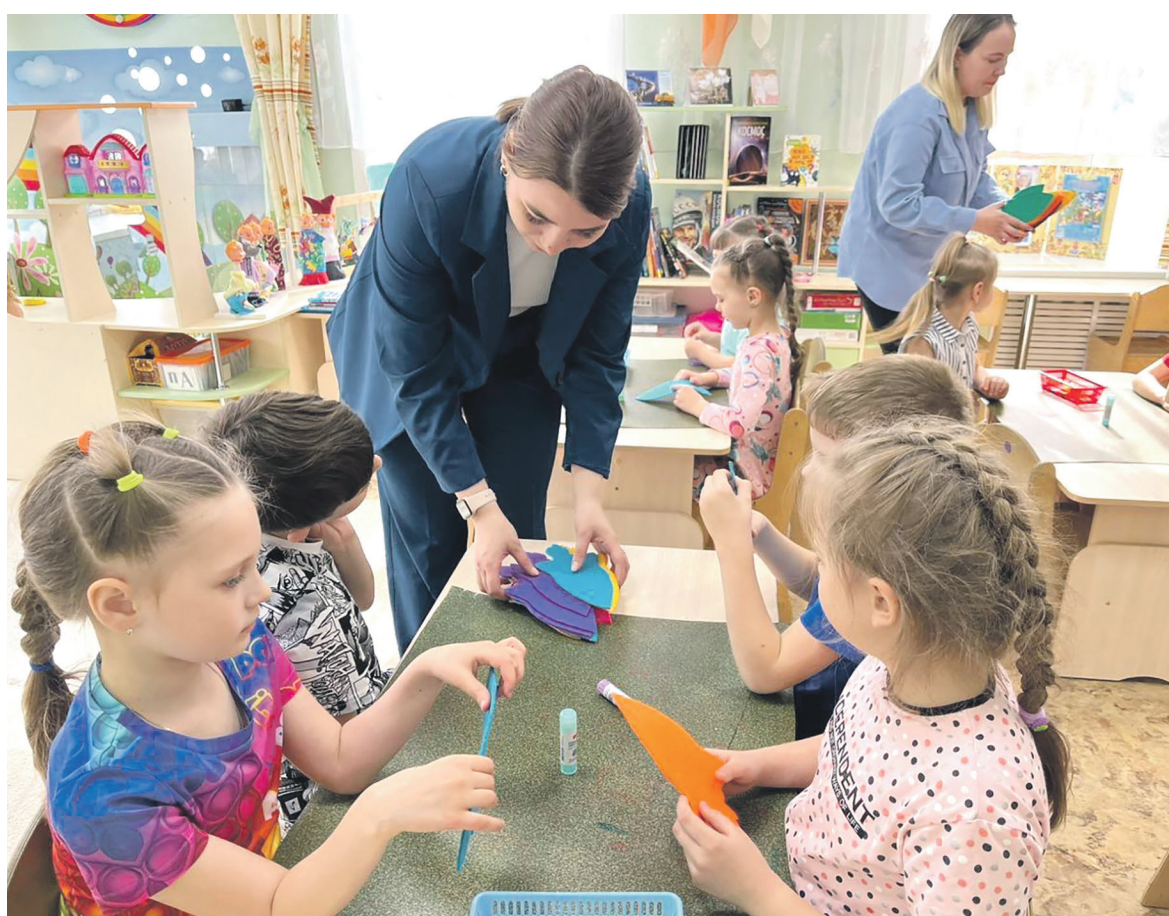
В честь празднования Дня космонавтики Молодежный совет Иркутского филиала Дорпрофжел на ВСЖД провел с дошкольниками мастер-класс «Ближе к звездам»