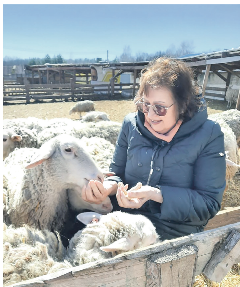
Экскурсию на экоферму «Сморodinский барашек» организовал профком больницы «РЖД-Медицина» г. Ульяновск»