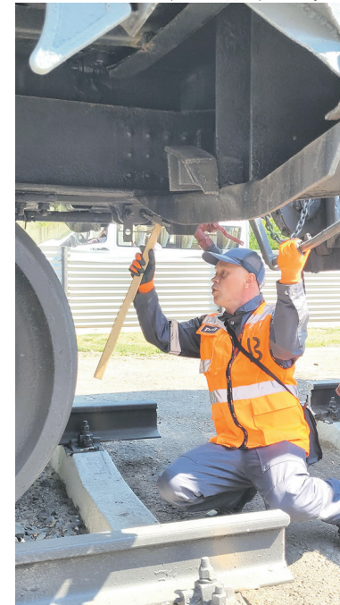
Осматриватели-ремонтники вагонов ПТО Орехово-Зуево — участники конкурсов профмастерства