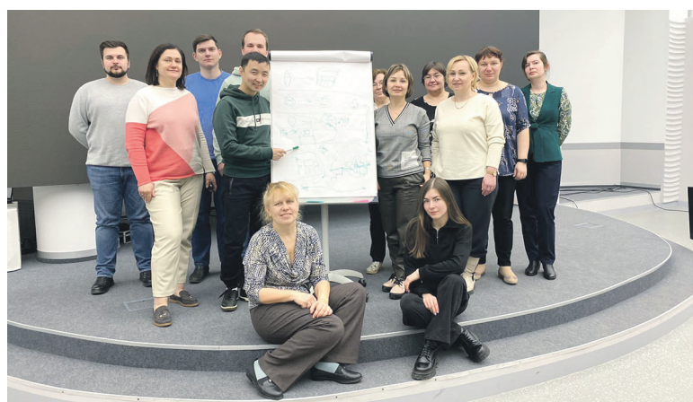
Первая группа «ЗОЖификации» закончила четырехнедельный курс обучения

Лекции по здоровому питанию проходят раз в неделю. В начале каждой лекции происходит контрольное взвешивание и ведется учет результатов участников. Причем даже анализ состава тела проводится на специальных весах Tanita. Они показывают не