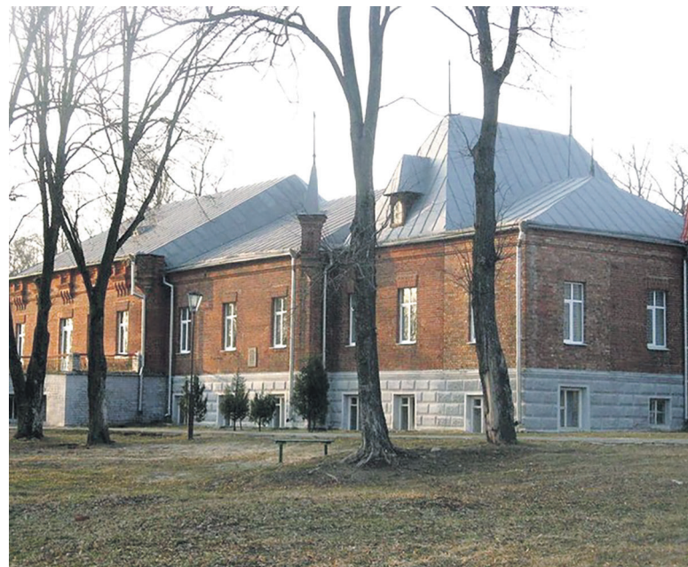
Сегодня в усадебном доме Маковых расположен детский реабилитационный центр «Пуховичи»

Наследники усадьбу быстро продали. И она сохранилась до наших дней, служит здравницей для детей.