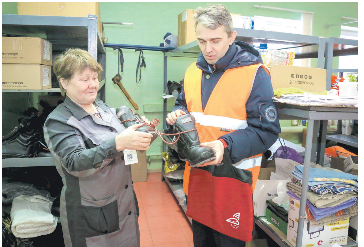
В прошлом году введена в обиход и новая коллекция спецодежды

Приоритетными направлениями программы являются психология и здоровье, финансовое благополучие, безопасность и особый акцент — это