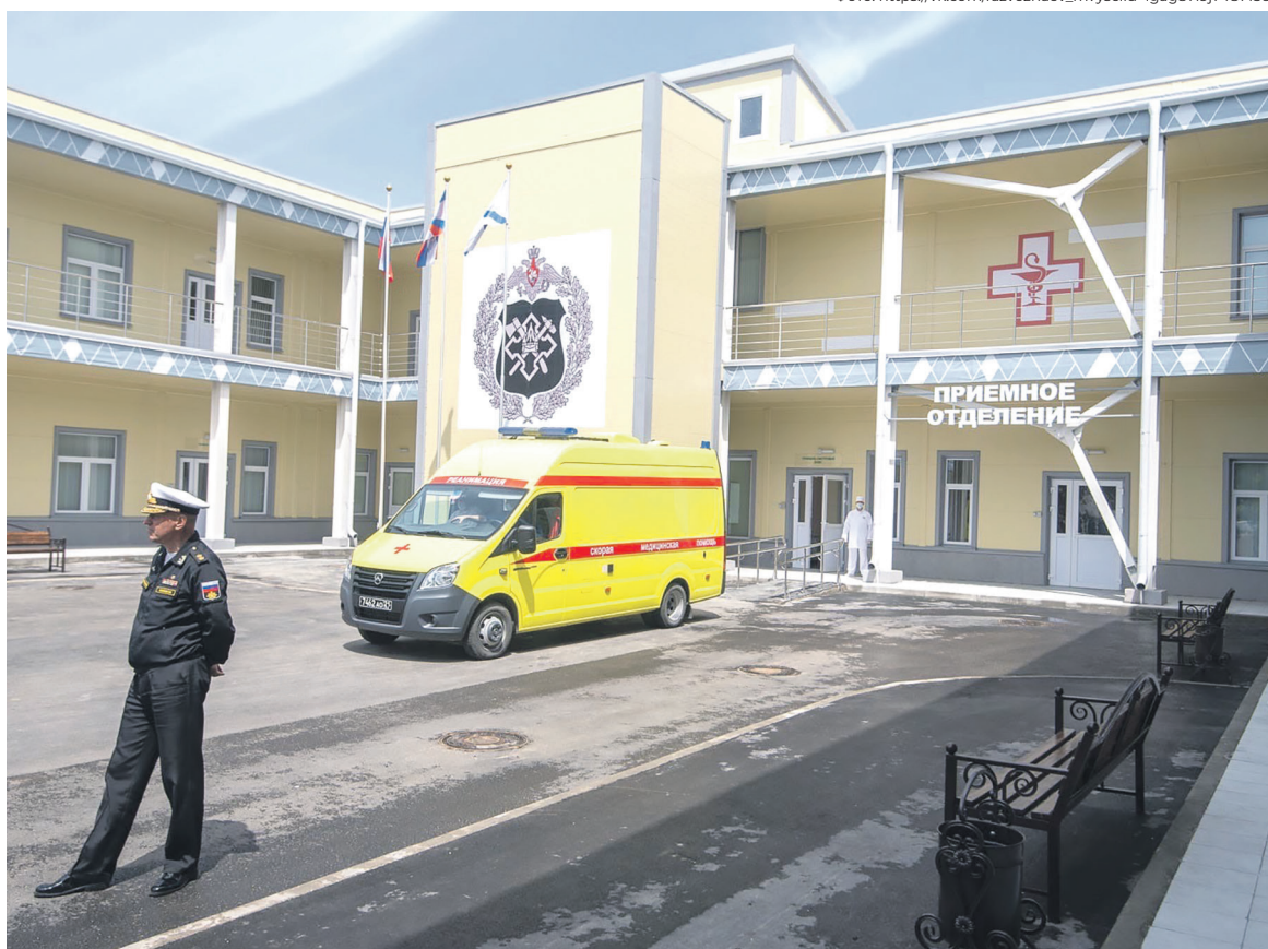
В госпиталь на собранные работниками Мосметростроя средства купили УАЗ

Второе направление — помощь бригадам морской пехоты и разведке Черноморского флота, чьи штабы дислоцируются в Севастополе. Первые контакты с командирами были через знакомых. Получили список необходимого оборудования: полевые и автомобильные радиостанции, ретрансляторы, обеспечивающие связь до 50 км, квадрокоптеры и многое другое. «Для них были важны определенные параметры: технику должно быть