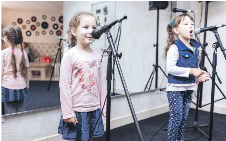
Сотрудники ПГК часто тратят баллы на обучение детей

«Кафетерий» как раз решает вопрос с предоставлением диверсифицированного пакета льгот, в котором каждый сотрудник может найти для себя что-то нужное. Один раз в квартал участникам программы начисля-