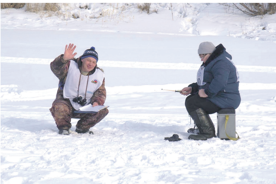
На реке Кан состоялся чемпионат Иланского узла Красноярской железной дороги по подледному лову, участие в котором принимали не только рыбаки, но и рыбачки