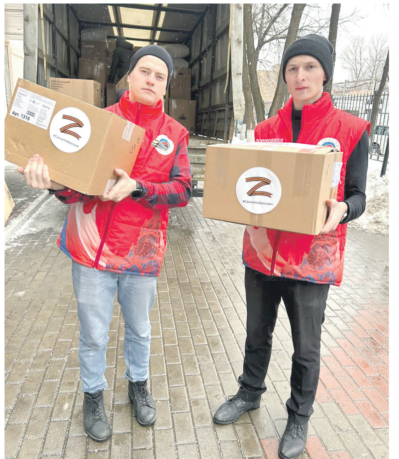
Более 10 тонн гуманитарного груза собрали члены профсоюза в рамках акции «Поможем железнодорожникам Донбасса!», организованной Дорпрофжел на МЖД