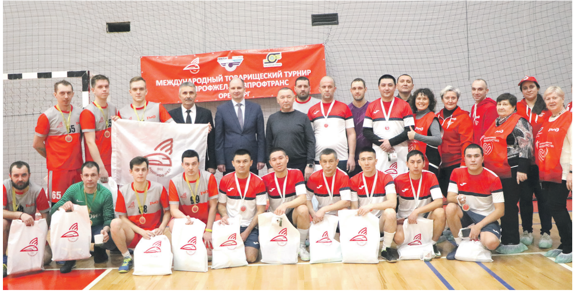
Оренбургский филиал Дорпрофжел на ЮВЖД провел товарищеский матч по мини-футболу среди команд — членов профсоюза Западного филиала КАЗПРОФТРАНС и их российских коллег. Спортивная удача встала на стороне команды россиян