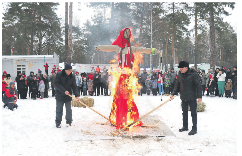
Дорпрофжел на ЮВЖД организовал для семей членов профсоюза масленичные гуляния, их посетили почти 2 тыс. человек