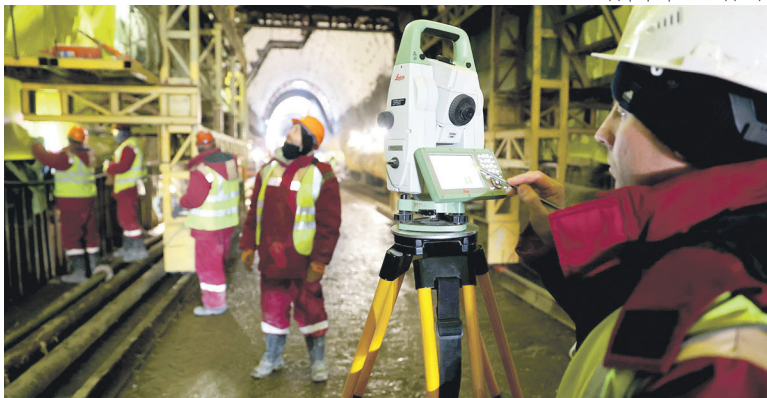
Проходку искусственных сооружений строители начали в августе прошлого года