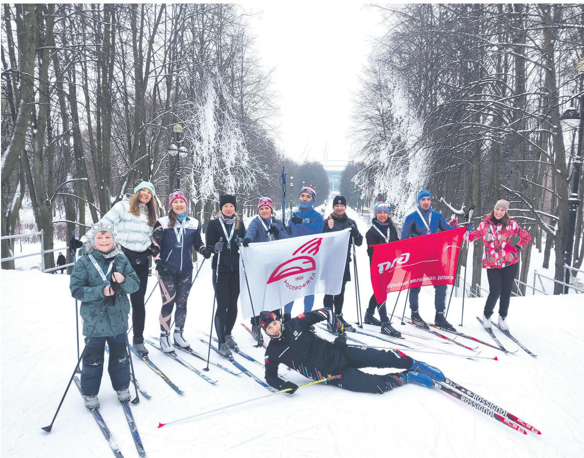
В Санкт-Петербурге прошли мероприятия, посвященные Дню зимних видов спорта. Члены профсоюза прокатились по подготовленной лыжной трассе на Крестовском острове