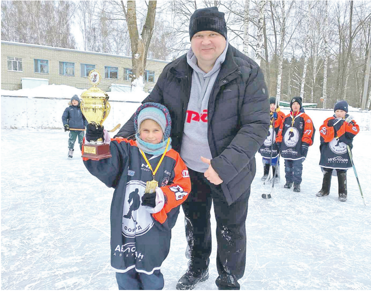
Детский спортивный праздник «Хоккей в валенках» состоялся в Пензе. Его инициаторами выступили профактивисты и члены хоккейной сборной эксплуатационного локомотивного депо