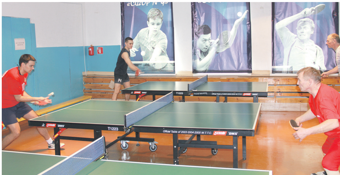
Соревнования на Кубок председателя Дорпрофжел на Забайкальской дороге по настольному теннису