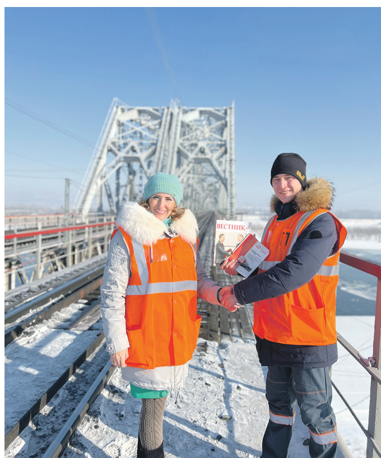
По традиции ППО дистанции инженерных сооружений на Западно-Сибирской магистрали профактив получил текст нового коллективного договора на рабочих местах