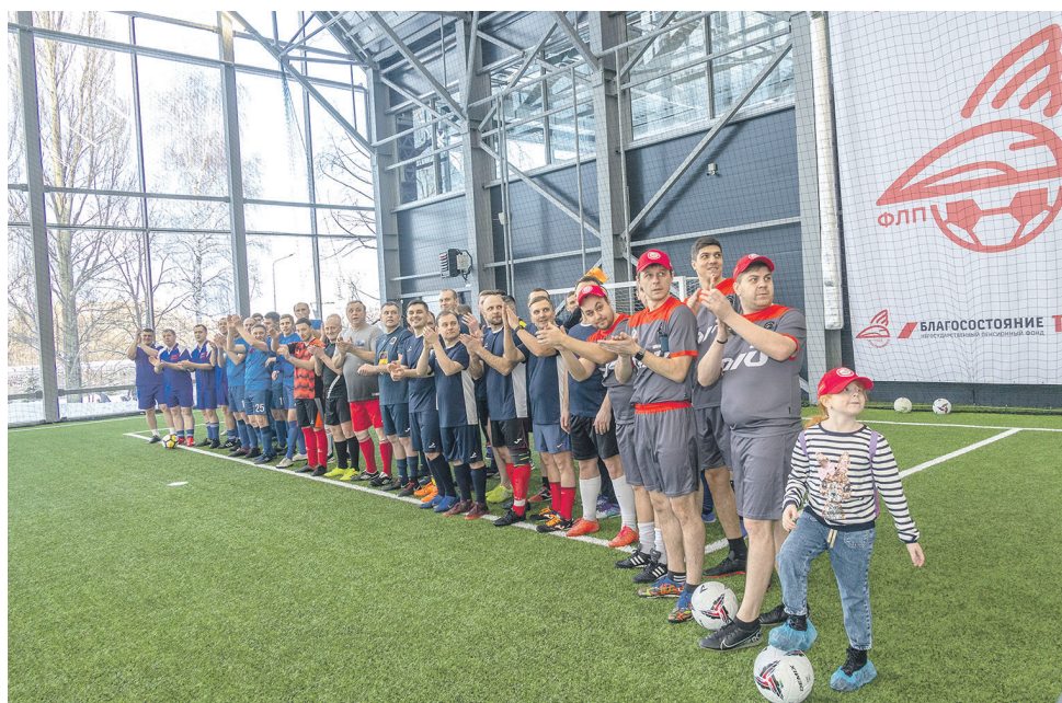
Торжественное открытие первого сезона футбольной лиги ППО работников аппарата управления ОАО «РЖД»