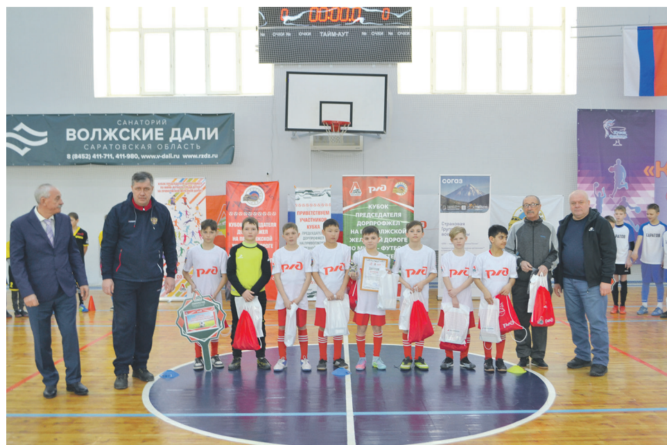
Шесть команд из Саратова, Волгограда, Верхнего Баскунчака, Красного Кута, Ершова, Сенного стали участниками турнира по мини-футболу среди детей на Кубок председателя Дорпрофжел на ПривЖД