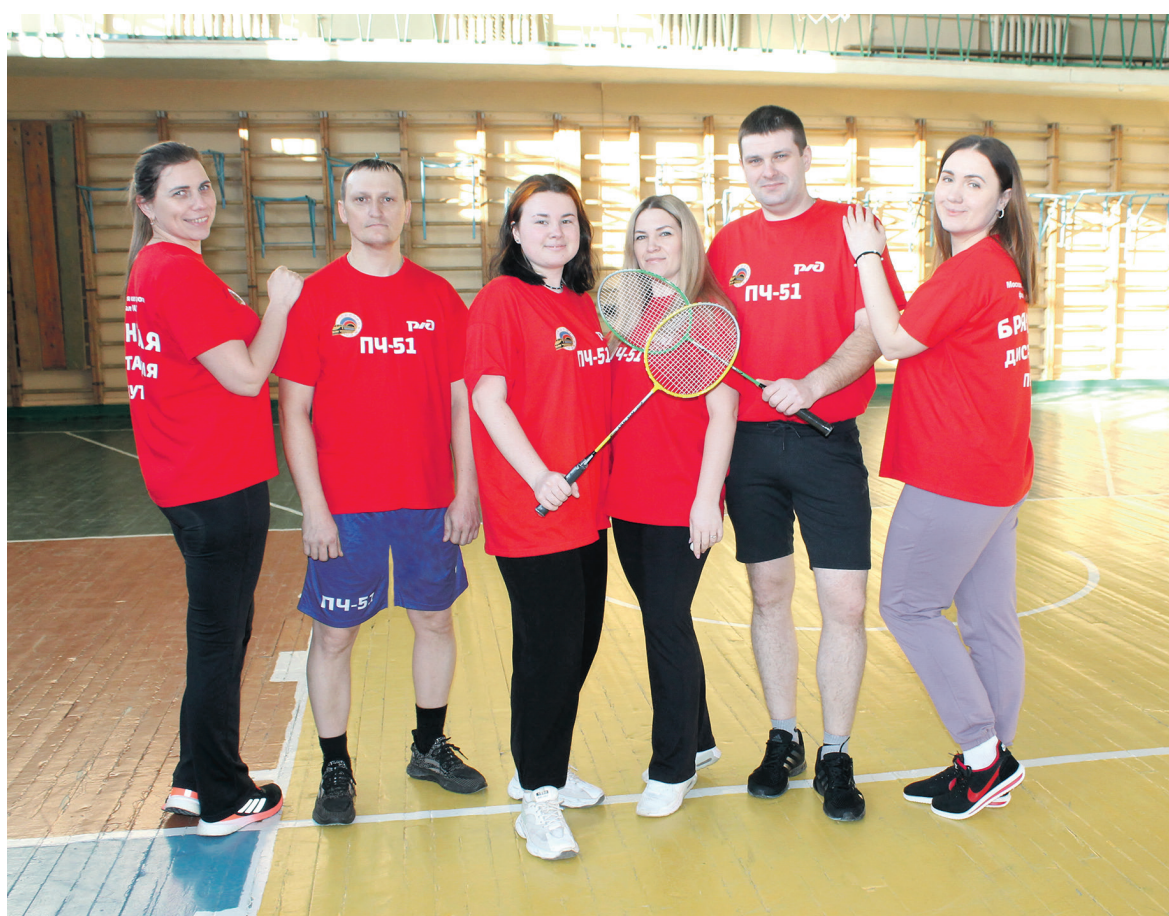
В Брянском региональном обособленном подразделении Дорпрофжел на МЖД прошел турнир по ракеточным видам спорта