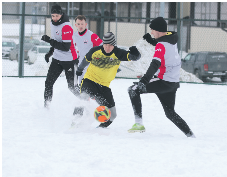
Финал зимней спартакиады Санкт-Петербургского территориального управления ОЖД включал в себя лыжные гонки и футбол на снегу