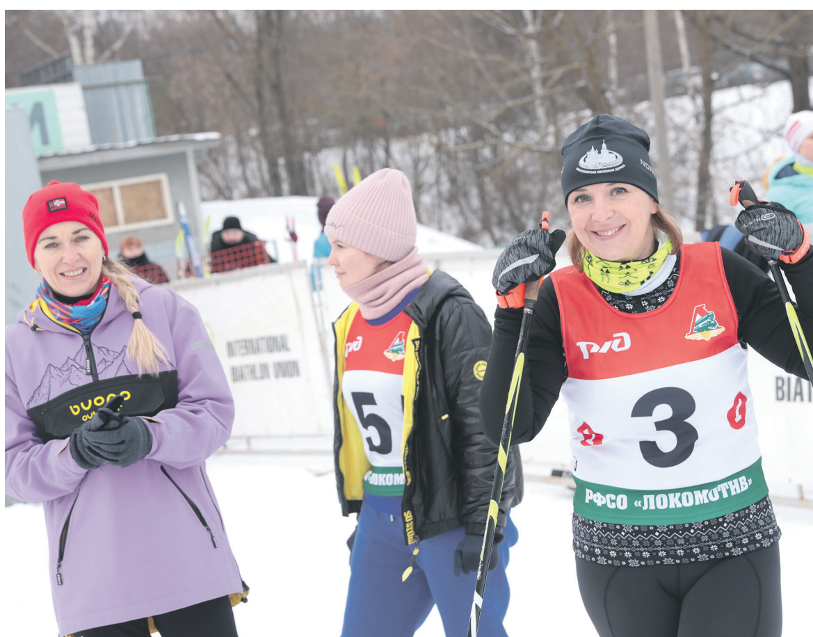
В последние выходные января на стадионе «Снежинка» в Химках состоялся чемпионат Московской железной дороги по лыжным гонкам