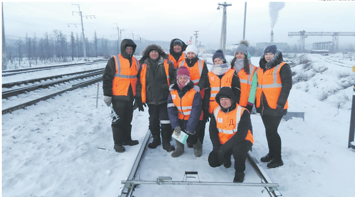
Какие бы ни были погодные условия, работа на железной дороге не должна останавливаться