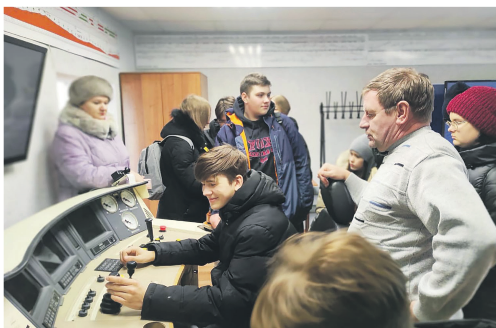
На профориентационной встрече со школьниками 9-х классов города Каменск-Уральского представители профактива эксплуатационного локомотивного депо рассказали о поддержке, которую оказывает профсоюзная организация молодым специалистам