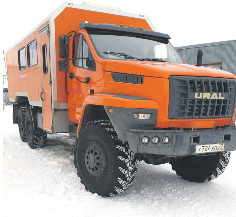
«Урал» и до работы довезет, и в мороз согреет

«Валенки — это традиционная и проверенная сотнями лет обувь для сильных морозов. На руках — утепленные рукавицы, лицо защищают балаклавы, —