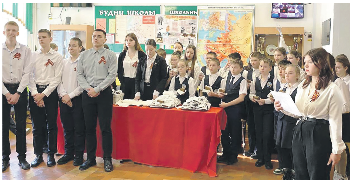
В День снятия блокады Ленинграда ученики МОБУ СОШ № 34 Лесозаводска совместно с первичкой Ружинской дистанции пути провели акцию «Блокадный хлеб»