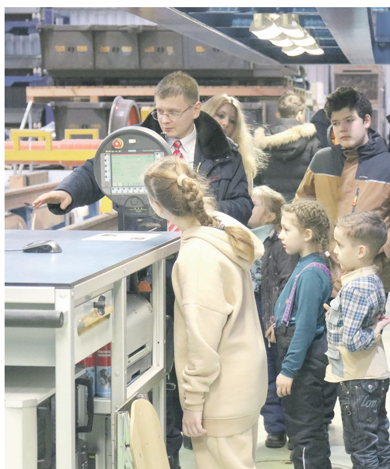
Молодежный совет Дорпрофжел на ОЖД организовал для детей железнодорожников экскурсию в Северо-Западную дирекцию скоростного сообщения