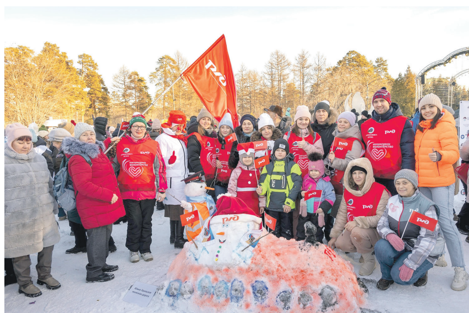
Волонтерский актив ЮУЖД и Дорпрофжел на ЮУЖД на ежегодном флешмобе снеговиков в рамках подведения итогов благотворительной акции «Снеговики-добряки»